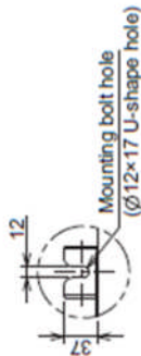
Details of B legs