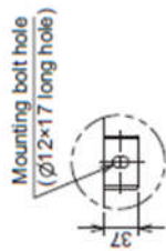
Details of A legs