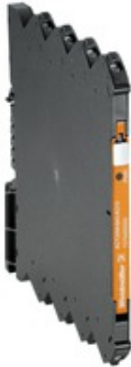
Illustration du produit, Similaire à l'illustration