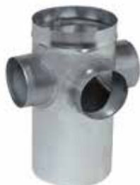
Collecteur Raccord d'Etage standard

Le CRE standard permet de raccorder 1 à 4 piquages sur la colonne verticale.