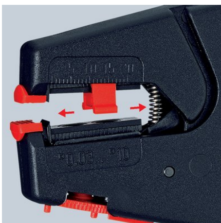
12 40 200: Butée longitudinale réglable

Sous réserve de toute modification technique et erreur.