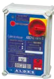
Coffret AXONE 1V/DES 16,7AMono230 T1