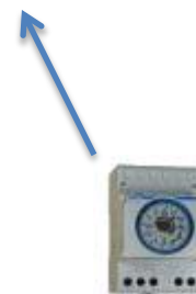
Entrée pour horloge programmable externe

2 options possibles pour la gestion du C/O :