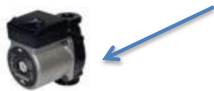
Asservissement pompe de circulation

Possibilité de raccorder jusqu'à 12 thermomoteurs