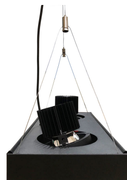
Système de suspension avec fils en triangulation réglable.