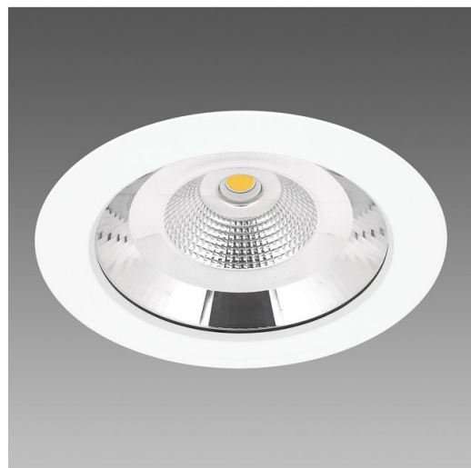
Jet 250 - IP65