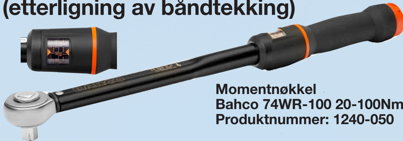
Momentnøkkel Bahco 74WR-100 20-100Nm Produktnummer: 1240-050

Konsoll fra forskjellige leverandører til båndtekkede tak og klikk fals skal monteres etter montasje anvisning fra de forskjellige produsenter. En ting som alle kanskje glemmer er at skruene skal trekkes til med en bestemt kraft. (Nm)