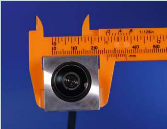
Bild 3: Ultrakompaktes Kameramodul von SMS Dresden mit HD-Sensor und INAP378T