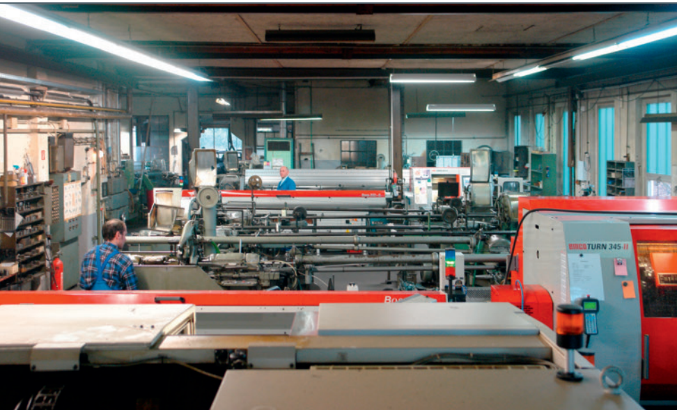
4 Angeschlossen werden kann die Werkzeugüberwachung an allen CNC-Maschinen. Vorn rechts im Bild das als erste mit dem ›Tool Monitor‹ ausgerüstete Emco-Drehzentrum