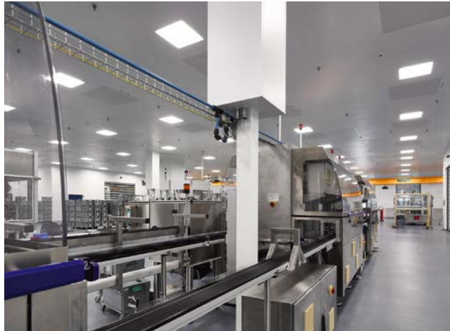
Bild 1. Reinraum: Nach der Herstellung der Kunststoffkomponenten und der hochautomatisierten Montage werden die Produkte verpackt, palettiert und sterilisiert

Eine erste Risikobeurteilung wurde auf Grundlage des Pflichtenhefts (Functional Specification) erarbeitet, die im Laufe der Design Qualification vervollständigt und abgeschlossen wurde (Bild 2). Das Prozessteam stellte sicher, dass Merkmale mit eventuell kritischen Auswirkungen schon frühzeitig erkannt wurden. Die im Team repräsentierten Interessengruppen konnten so über den gesamten Planungsprozess Einfluss auf die Lösungen nehmen und auf Zielkonflikte hinweisen. Risikoanalysen halfen, GMP-relevante von nicht GMP-relevanten Punkten zu unterscheiden. Bereits diese selektive Vorgehensweise verminderte den Qualifizierungsaufwand erheblich.