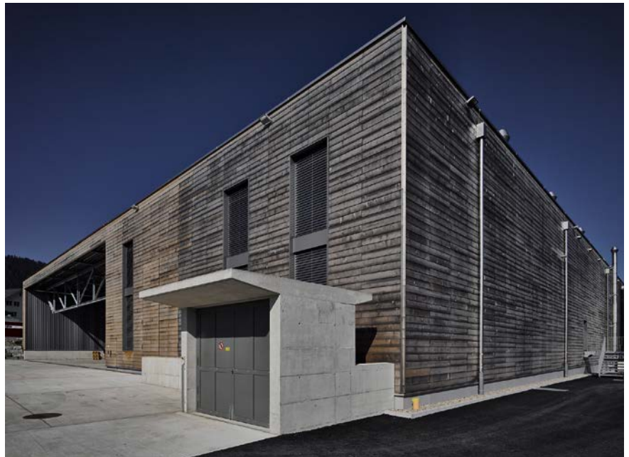
Erweiterungsbau: Die B. Braun Medical AG verdoppelte in Escholzmatt/Schweiz ihre Produktionskapazität mit einem Neubau auf dem bestehenden Areal

Das Planungsunternehmen der IE-Group mit Sitz in Zürich und München, das auf