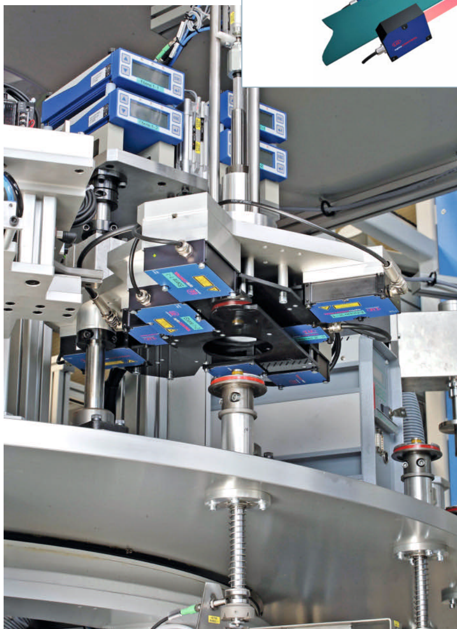
Bild 3. Durch das Baukastenprinzip lässt sich die Mechanik der Sensoren zur Spalt- und Kantenmessung an die Anwendung anpassen.

CCD-Aufnehmer, der Auflösungen im Mikrometerbereich ab 0,25 µm ermöglicht.