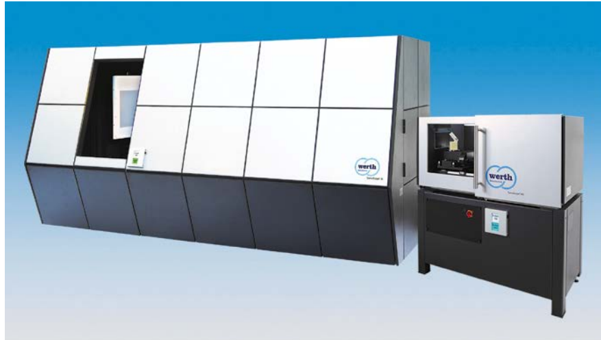
Bild 2. Kompakte Geräte können an fast jedem Ort aufgestellt werden: flexibles Messgerät für große Werkstücke (links), Kompaktgerät mit Transmissionsröhre im Monoblock-Design (rechts).

Durch die Kombination von Konstruktionsprinzipien der Koordinatenmesstechnik mit der Röntgensensorik realisierte Werth Messtechnik im Jahr 2005 das erste speziell für die Koordinatenmesstechnik konzipierte Gerät mit Röntgentomografie-Sensorik, optional mit Multisensorik (Herstellernangabe). Neben einer soliden Hartgesteinbasis kommen heute in diesen Geräten Präzisionsführungen, luftgelagerte Drehachsen, Temperatur- und 3D-Geometriekorrektur sowie viele andere Verfahren zum Einsatz. Langzeitstabil eingemessene Vergrößerungen gewährleisten die Rückführbarkeit der Messergebnisse und sparen Zeit. Heute