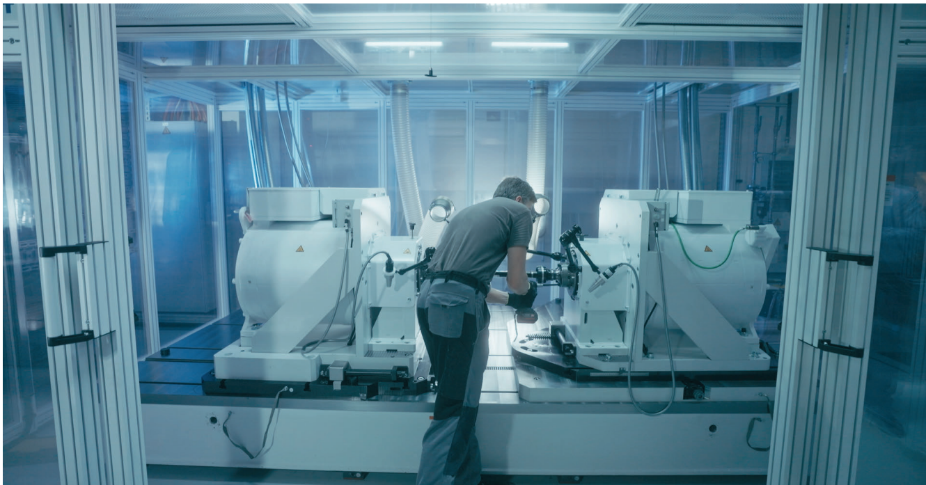
GKN Automotive verfügt über einen speziell für das Unternehmen entwickelten Echtzeit-Prüfstand, der nur zur Erprobung von Antriebswellen für elektrische Fahrzeuge genutzt wird.

und wir nutzen diese zur Entwicklung von Prüfroutinen und sind in der Lage den gesamte Last-Zeit-Verlauf in Echtzeit auf dem Prüfstand zu simulieren.