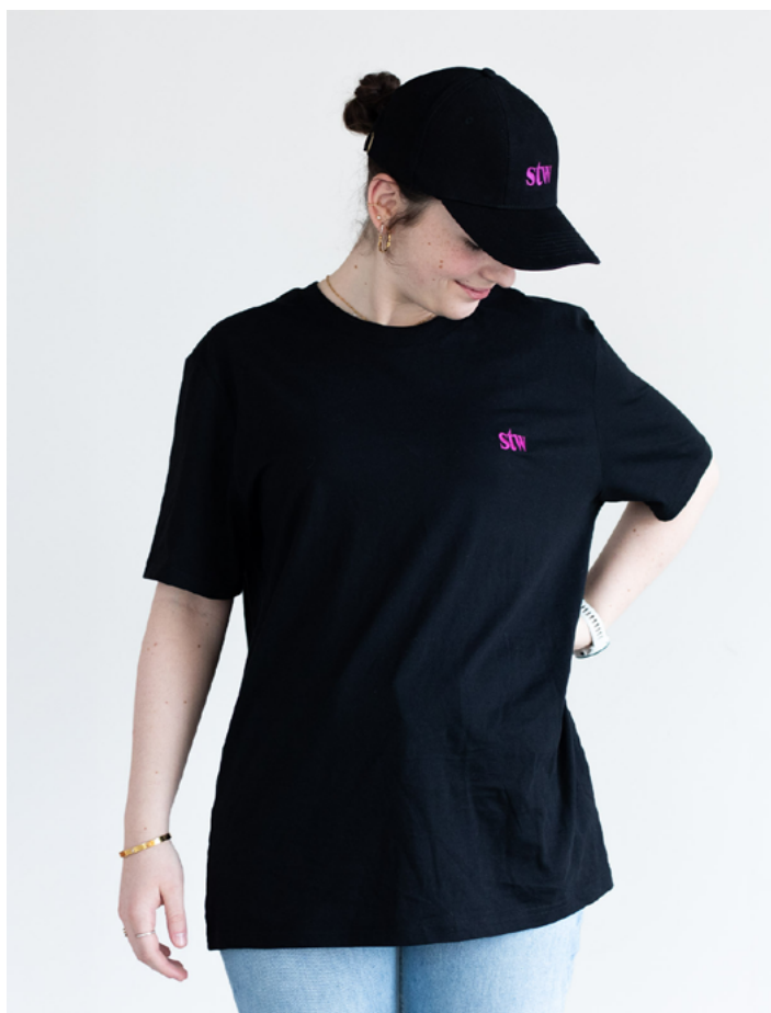
Das Model ist 1,66 und trägt Größe L.