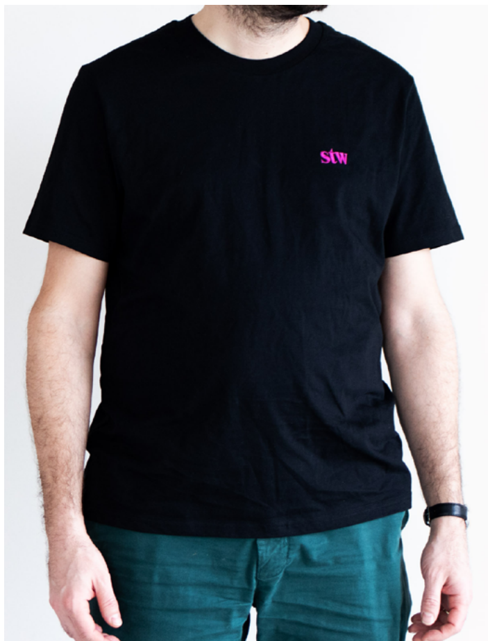
Das Model ist 1,86 und trägt Größe L.