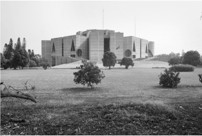
Abb. 1: Eine Zitadelle der Demokratie? Louis Kahns Parlamentsgebäude in Dhaka.

terten Platz vor dem Parlamentsgebäude berichtete von dessen »Erstürmung« im Sommer 2024 und erzählte, dass in dem Wasser, das die von Kahn einst so genannte »Zitadelle« für die parlamentarische Versammlung umgibt, damals Leichen trieben. Ich fragte mich, ob die Bürger wohl ihre politische Wut an dem Gebäude ausgelassen hatten. Aber welchen Sinn hatte es, das angebliche politische Gewissen eines Landes anzugreifen?