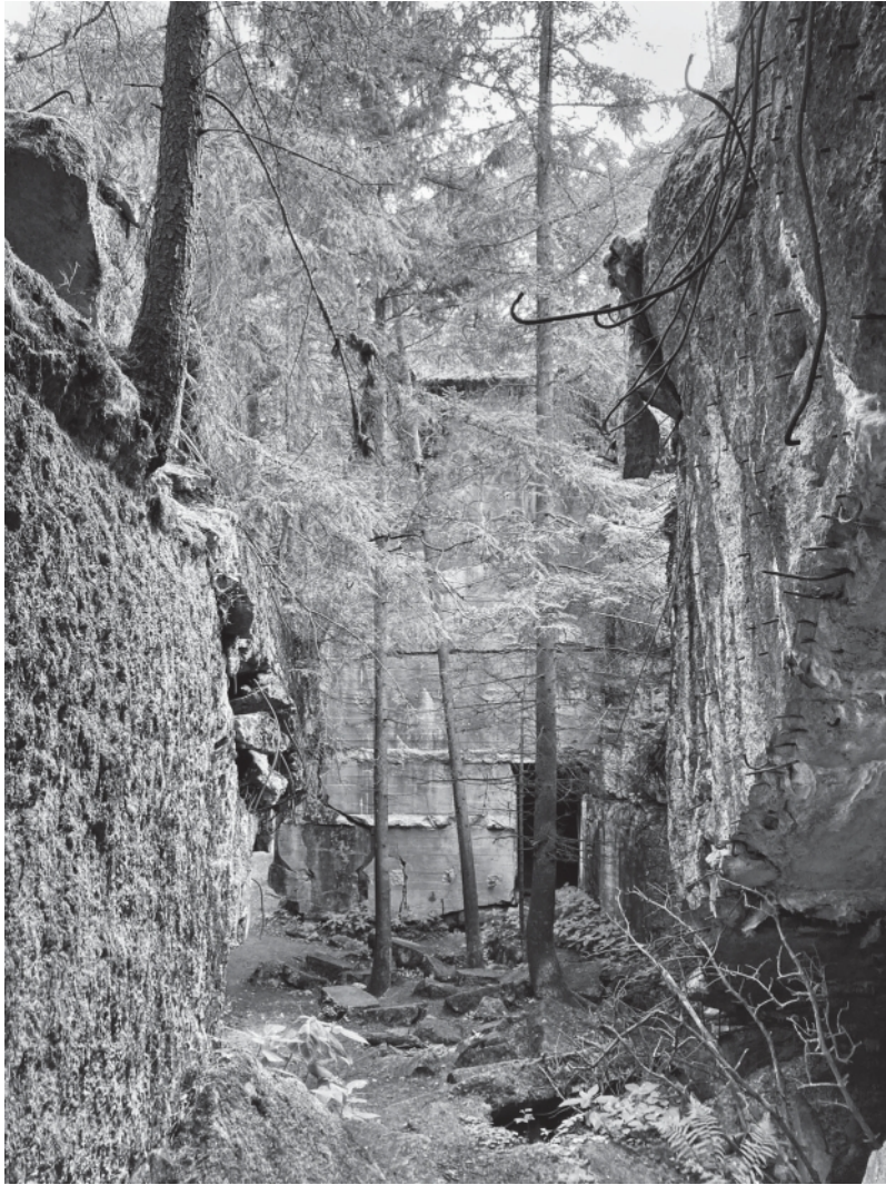
Abb. 4: Eingang zu einer Bunkeranlage

die Wolfsschanze. Der oft im Sperrkreis anwesende NS-Rüstungsminister Albert Speer resümierte nach 1945: »Was die Entscheidungen Hitlers an der Front, wo gekämpft und gestorben wurde, bedeuteten, bewegte uns in der abstumpfenden Welt des Hauptquartiers nicht.« Der Historiker und Schriftsteller Felix Hartlaub, Mitarbeiter der Stabsstelle Kriegstagebuch des Oberkommandos der Wehrmacht in Sperrkreis II, schrieb in der zweiten Jahreshälfte 1944: »Hier ist noch kein scharfer Schuss, keine einzige Bombe gefallen, diese seltsame Ausgespartheit hier, manchmal kommt sie einem etwas unheimlich vor.« Man lebe wie unter einer Glasglocke. Das Einzelleid der Menschen draußen spiele für die Mitarbeiter in