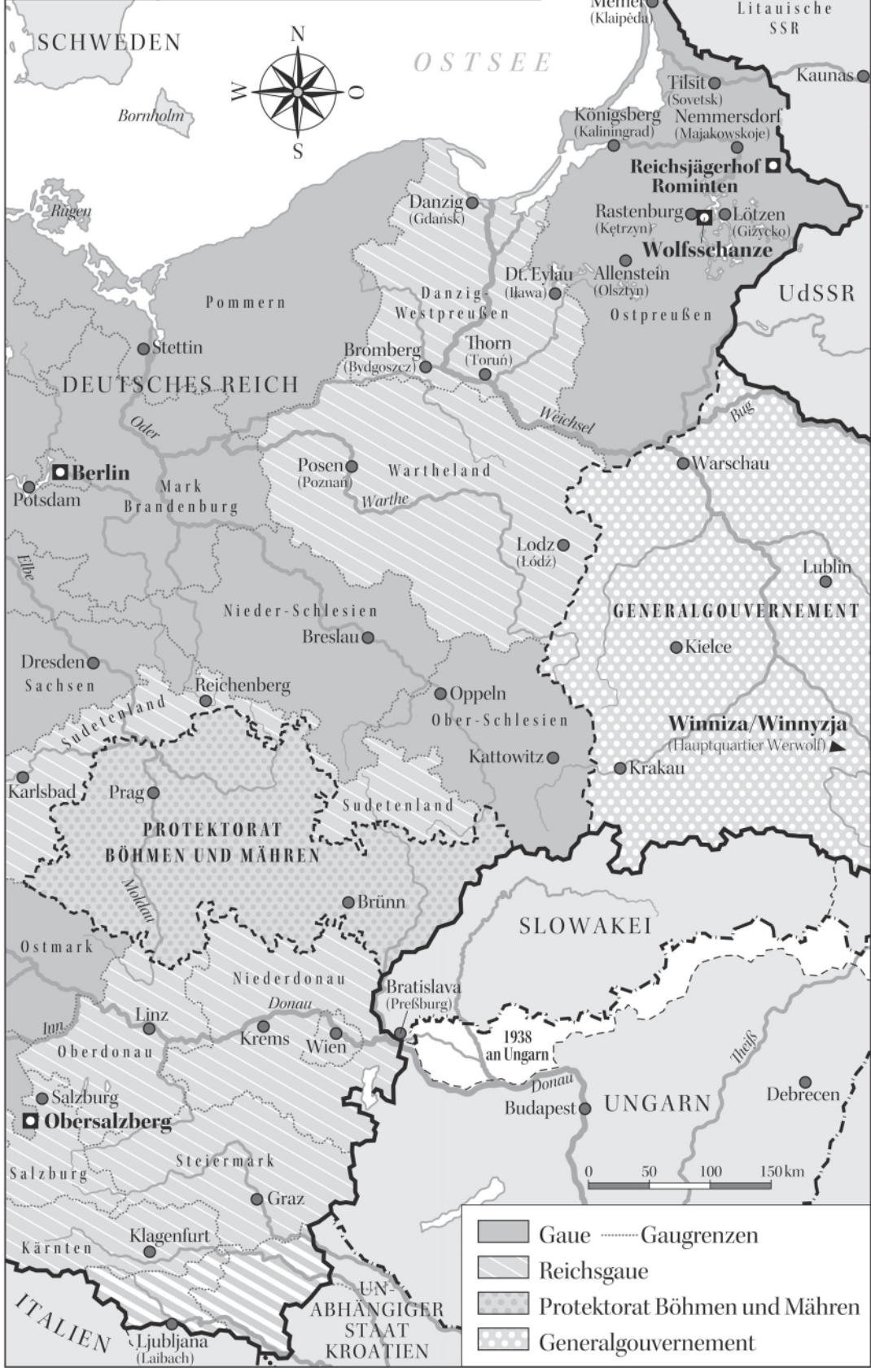
Lage der Wolfsschanze im äußersten Osten des Deutschen Reichs, 1941