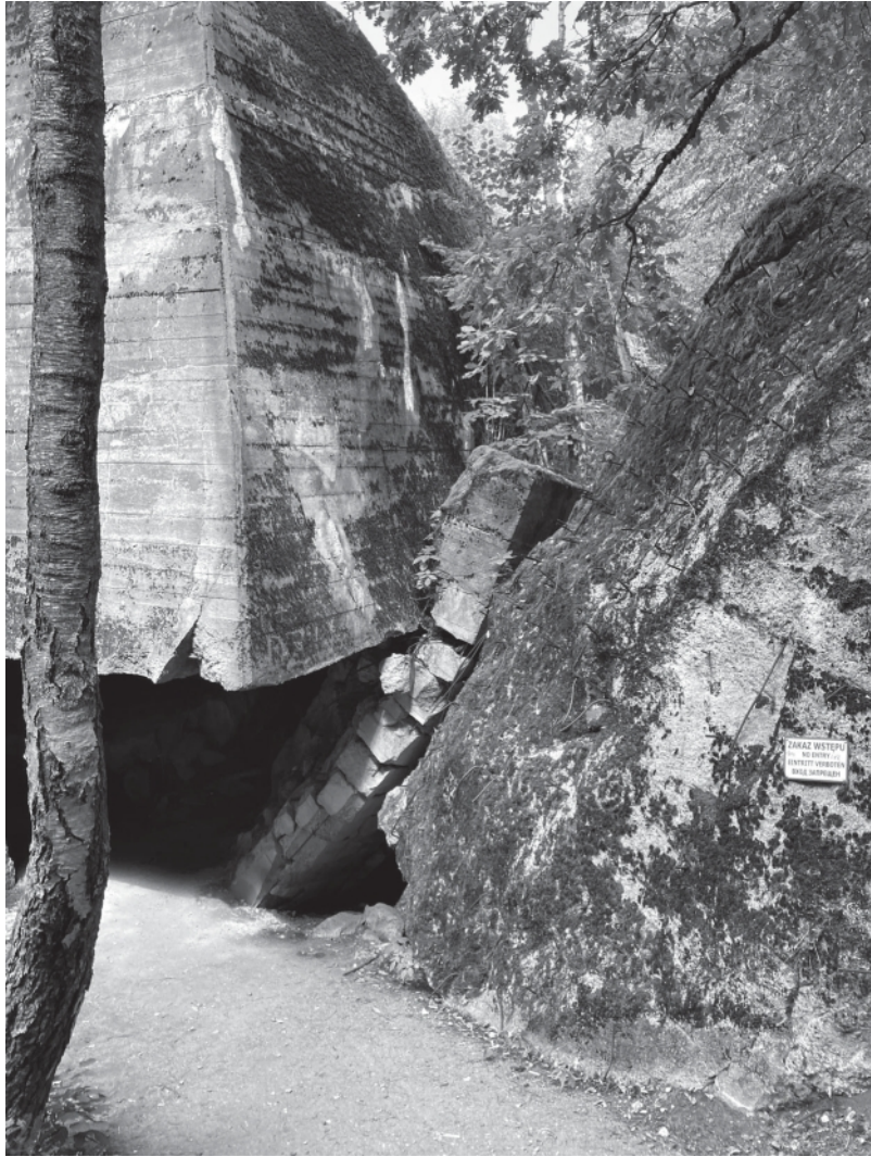
Abb. 3: Gewaltige Beton- und Steinmassive

einem baldigen Sieg wieder zu verlassen. Doch der Feldzug stagnierte, man blieb, und die Wolfsschanze wurde zur eigentlichen Zentrale des »Dritten Reichs«.