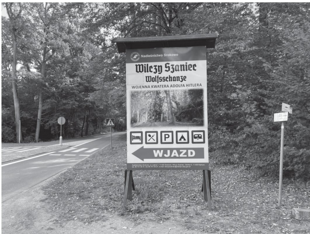
Abb. 1: Einfahrt in die heutige »Touristenattraktion« Wolfsschanze

Die sandigen Waldwege, auf denen ich am Zeiser See gestartet bin, sind inzwischen zu preußischen Pflasterstraßen geworden. Schließlich gelange ich von Süden kommend an eine Landstraße, die noch heute das Gelände teilt. Sperrkreis II lag südlich, Sperrkreis I nördlich von ihr. Sie verband schon vor dem Bau der Wolfsschanze Rastenburg mit Angerburg, war zu Kriegszeiten jedoch unpassierbar. Das Führerhauptquartier war Sperrgebiet. Heute befindet sich an der Landstraße die Einfahrt zu dem historischen Ort und zu Sperrkreis I. Auf einem großen Schild steht »Wileczy Szaniec«, der polnische Name für Wolfsschanze. Ich überquere die Straße und laufe vorbei an einem Kassenhäuschen mit einer Schranke. Davor halten Reisebusse. Der Eintritt kostet 20 Złoty, also rund 4,70 Euro. Die Erinnerungsstätte besteht in erster Linie aus einem Rundgang mit Erklärtafeln. In einem der Bauten ist das Innere der Besprechungsbaracke vom 20. Juli 1944 nachgestellt, mit einer skurril wirkenden, puppenartigen Hitlerfigur in Lebensgröße.