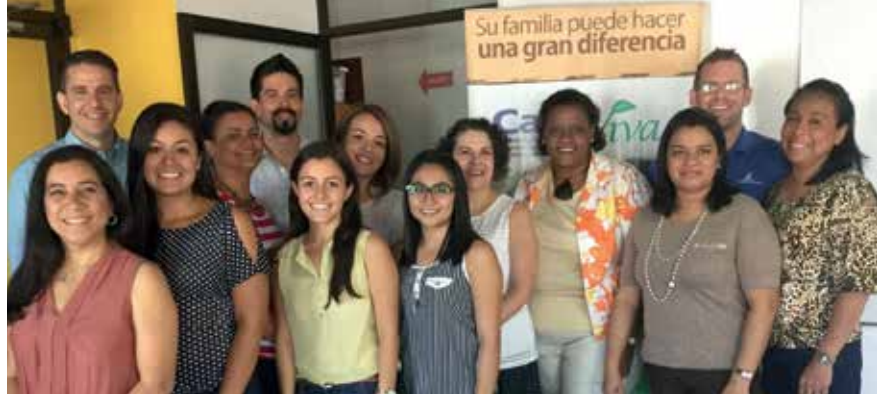
Participantes de Honduras, Panamá, Costa Rica y República Dominicana al finalizar un curso de capacitación de Casa Viva.

Casa Viva es la única organización que implementa de forma activa el acogimiento familiar en Costa Rica. En colaboración con la iglesia local, animan a las familias a ofrecer un hogar a los niños necesitados.