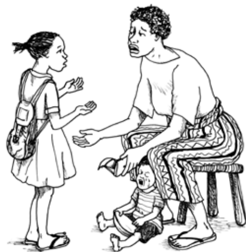
En los países en desarrollo, la pobreza con frecuencia es la razón por la cual las familias envían a los niños a los orfanatos.

World Without Orphans Sitio web: www.worldwithoutorphans.org Correo electrónico: info@worldwithoutorphans.org