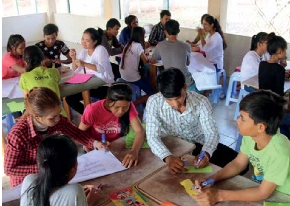
Un grupo de jóvenes en una capacitación de habilidades prácticas para la vida sobre control de la ira.

Los jóvenes que han egresado de las instituciones se encuentran en una posición única para ayudar a otros jóvenes que pronto saldrán de los orfanatos. Visitan las