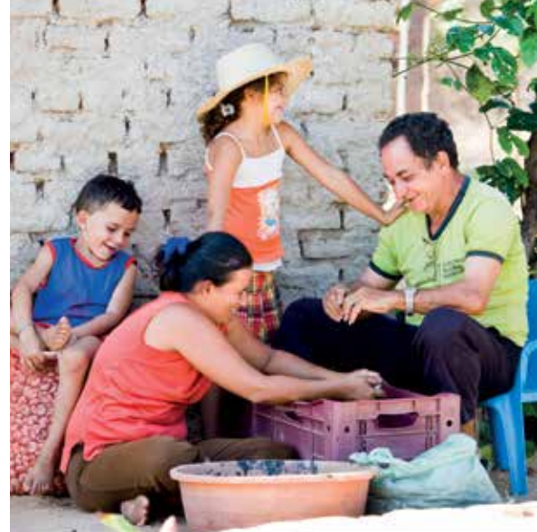
Una familia estable y afectuosa es el entorno ideal para criar a los niños.

posibilidades de adquirir las habilidades prácticas para la vida que necesitarán para asegurar su independencia en el futuro.