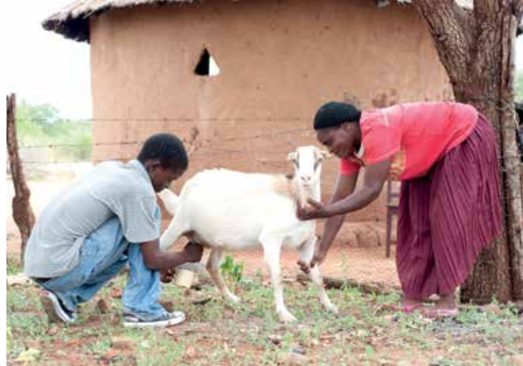
☑ ZOE brinda oportunidades de medios de vida a las familias de los niños huérfanos y los voluntarios de las iglesias ofrecen asistencia.