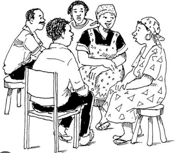
¿Cómo le daríamos la bienvenida a un exconvicto en nuestra iglesia o grupo de estudio bíblico?