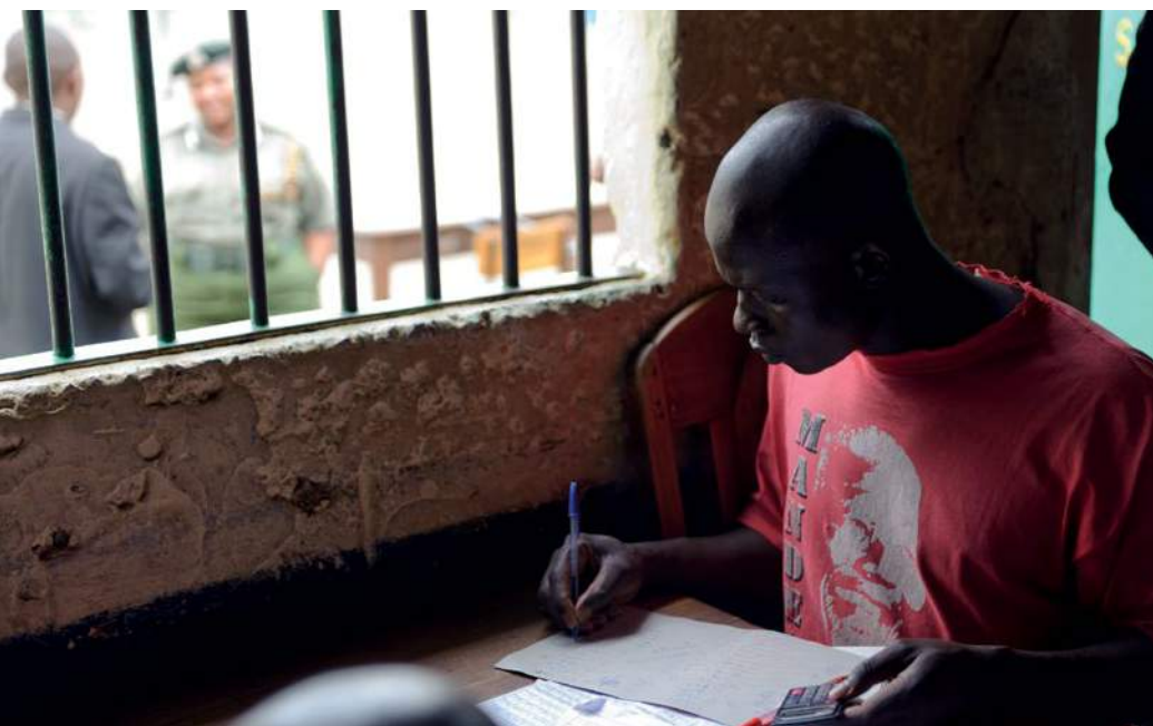
📷 ¿Es la cárcel solo un castigo que debe sufrirse o un lugar donde puede ocurrir la transformación positiva?

En un gran número de países de ingresos bajos, la consecuencia de que un padre vaya a prisión puede resultar devastadora para el bienestar económico de la familia. Más de catorce millones de niños en el mundo tienen a su padre o su madre en prisión. Estos niños se exponen a peligros como la pobreza, la