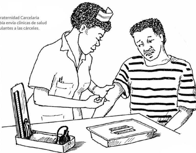
Confraternidad Carcelaria Zambia envía clínicas de salud ambulantes a las cárceles.

También capacitamos a ciertos presos para desempeñarse como lo que llamamos «asistentes de tratamiento». Como se ha ilustrado con la obra de teatro que mencionamos más arriba, cuando los presos son diagnosticados con el VIH, con frecuencia se sienten desesperados y no pueden entender el sentido de tomar los medicamentos. Los asistentes de tratamiento son fuente de apoyo para estos reclusos. Los ayudan a darse cuenta de que un día tendrán un futuro fuera de la cárcel, de modo que vale la pena tomar los medicamentos.