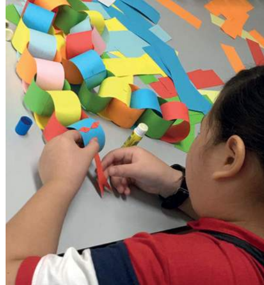
Las actividades creativas ayudan a los hijos de presos a relajarse y a divertirse.

campamentos durante las vacaciones escolares donde realizamos actividades divertidas con los hijos de los presos.