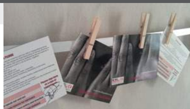
☒ Promesses We Will Speak Out.

Nous nous unissons dans la solidarité avec les plus vulnérables et les plus affectés.