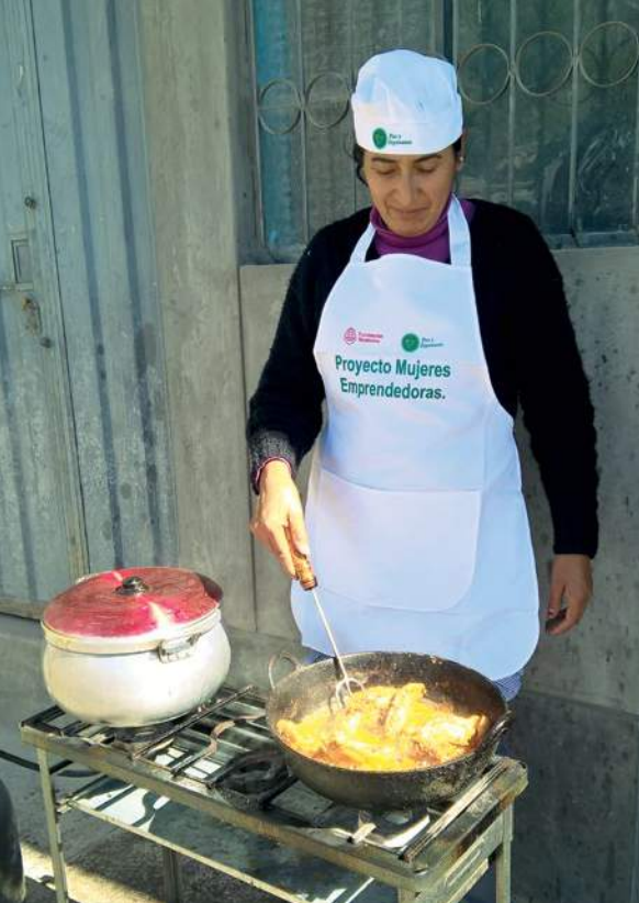
☐ Paz y Esperanza aide les femmes entrepreneures à développer et à commercialiser leurs produits.

des plans pour les infrastructures et l'irrigation.