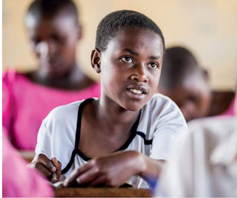
📷 Promouvoir l'éducation des filles peut être une approche efficace pour lutter contre les MGF/E.

Tout un éventail de stratégies ont été utilisées par différentes organisations pour encourager les gens à renoncer aux mutilations génitales féminines et à l'excision. Bien souvent, différentes stratégies sont combinées. Mais à quel point sont-elles efficaces ? Explorons quelques approches.