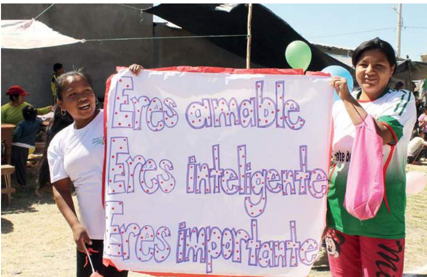
📷 Filles participant à une campagne de sensibilisation visant à réduire les VSBG. Banderole : « Tu es digne d'amour, tu es intelligente, tu es importante. »

Au Pérou, les administrations locales tiennent une consultation budgétaire participative annuelle, qui permet aux citoyen-ne-s d'exprimer ce qu'ils souhaitent voir financé. Dans la région d'Ayacucho, cette consultation est dominée par les hommes qui proposent