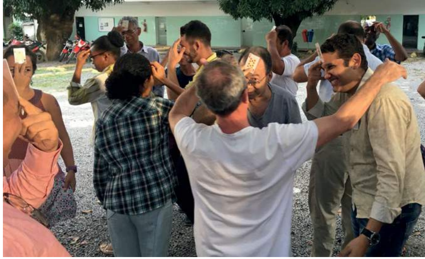
Un groupe au Brésil participe à une activité du programme Transformer les masculinités sur l'égalité hommes-femmes, le pouvoir et le statut.