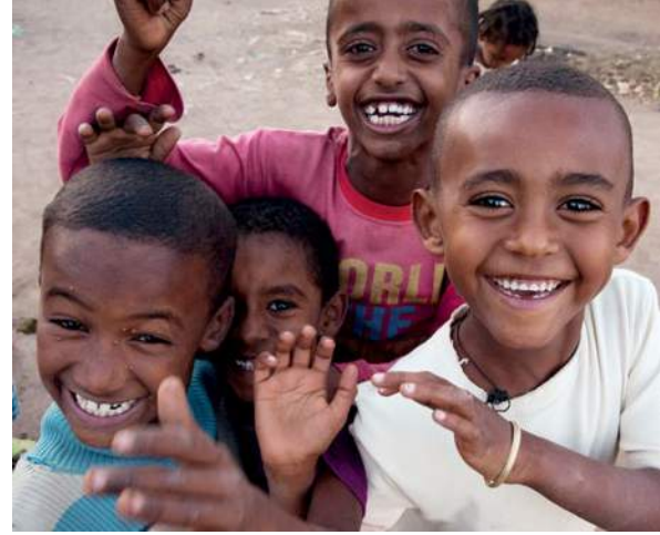
Il est important de faire participer les hommes et les garçons à la lutte contre les VSBG.

qu'il est important de faire participer les hommes et les garçons.