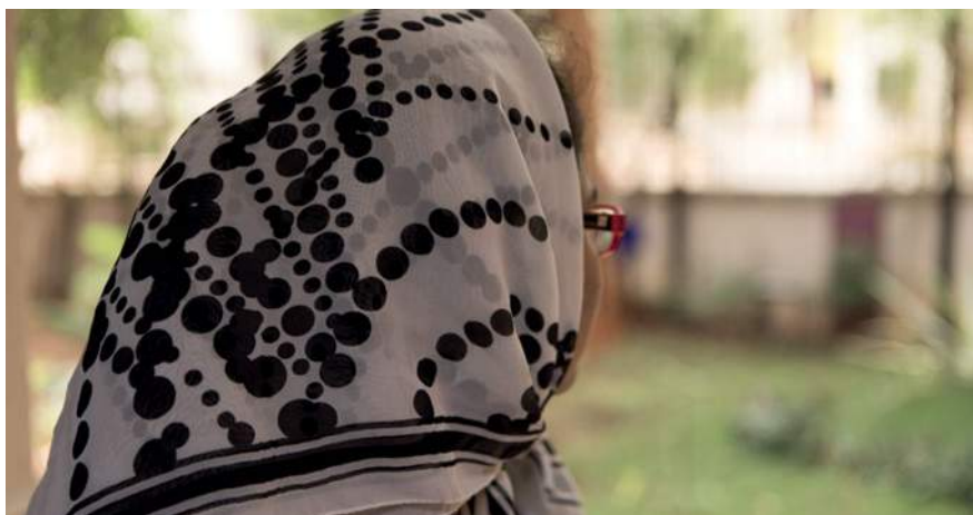
Les survivantes de VSBG taisent souvent leur souffrance.

Les survivantes de violences sexuelles et basées sur le genre (VSBG) gardent souvent le silence au sujet de ce qu'elles endurent ou ont enduré, ce qui renforce leur sentiment d'isolement. Si elles ne s'expriment pas, c'est souvent parce qu'elles sont menacées par la personne qui les maltraite, qu'elles ont peur d'être stigmatisées ou discriminées, et qu'elles ont perdu tout espoir que quelqu'un les aide.