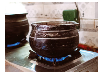
Um biodigestor bem gerido fornecerá um suprimento consistente de combustível para cozinhar.

O biodigestor precisa ser alimentado regularmente para manter o processo de biodigestão e garantir um suprimento constante de combustível.