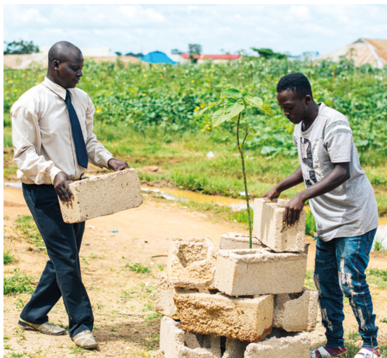
Dando el ejemplo: el personal de una organización socia de Tearfund protege un árbol recién plantado.