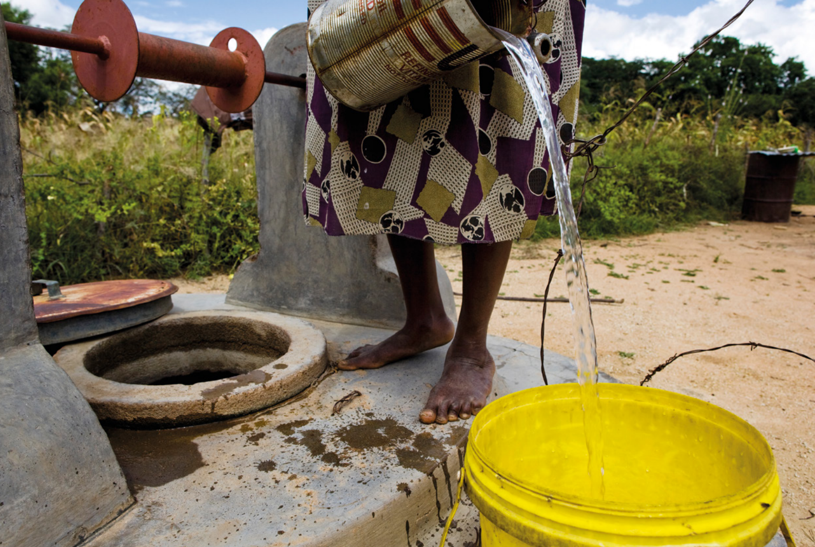
❏ Los facilitadores comunitarios visitan los hogares para recopilar información sobre los servicios, como los de agua.