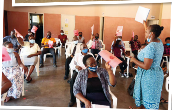
Capacitación de facilitadores comunitarios por Evangelical Fellowship of Zimbabwe.