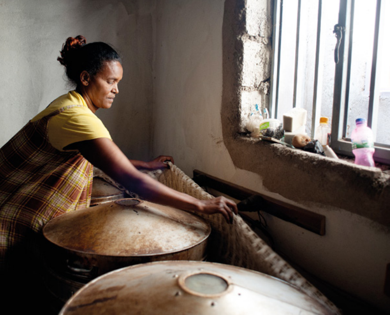
❏ Esta panadera etíope ha utilizado pequeños préstamos otorgados por su grupo de autoayuda para ampliar su negocio.