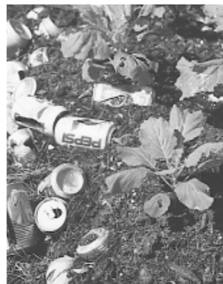
As plantas crescem bem numa mistura de solo e latas de refrigerantes vazias.

Em vez de latas pode-se também usar a palha de coqueiros, que é porosa e leve.