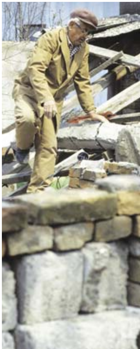
Las barreras entre las personas en conflicto no son sólo físicas.

personas, como entre un hombre y su esposa, entre los que antes eran amigos, o entre 'ellos' y 'nosotros'. Pueden simbolizar una relación basada en la desconfianza, en lugar de basarse en la confianza. Cada omisión o acto mal interpretado agrega