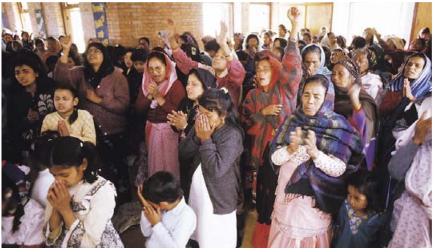
En cualquier comunidad, incluso en las iglesias, hay potencial para el conflicto.