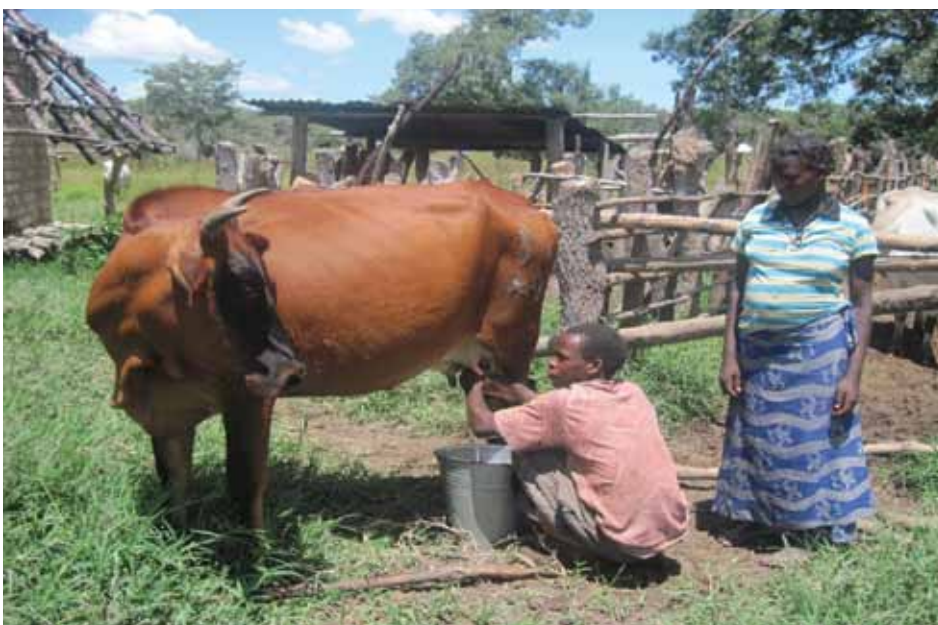
Esta vaca lechera da nueve a 15 litros de leche al día a una pareja joven en Zambia.

GRANJERO SAM: ¿De qué están hablando? Por favor, explíquense.