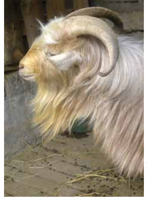
La lana de las cabras puede convertirse en una fuente de ingreso. Puede hilarse para hacer hilo y tejerse para fabricar ropa de abrigo.