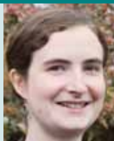
Alice Keen Editora

Todos dependemos del ganado para obtener distintos productos y servicios. No importa si vivimos en ciudades o en zonas rurales, los animales nos dan