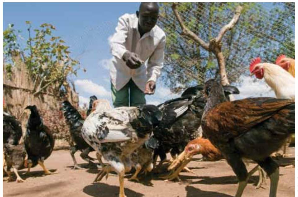
Las aves de corral pueden encontrarse en casi todos los rincones del mundo y proporcionan huevos y carne a muchas familias.

La probabilidad es que esta escala de industria aumente debido a la creciente demanda de productos ganaderos de parte de los países en desarrollo, la cual se espera que se duplique en los próximos 20 años. La producción ganadera podría proporcionarles a varios cientos de millones de personas la oportunidad de salirse de la pobreza.