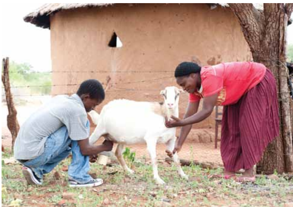
El asociado de Tearfund, ZOE, trabaja con hogares a cargo de niños en Bulawayo, Zimbabwe, proporcionándoles cabras para generar ingresos.

Un buen ejemplo es Indonesia: hoy en día cuenta con una población de casi 250 millones de personas y el país se está urbanizando rápidamente, pues se espera que más del