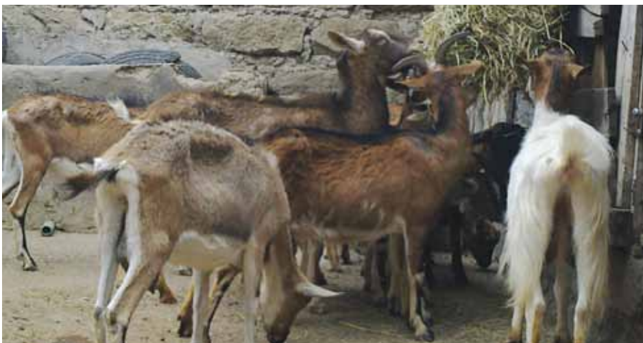
Las cabras son idóneas para ser criadas en asentamientos informales, pues no necesitan grandes áreas donde pastar.

Para obtener más detalles sobre este proyecto, favor de comunicarse con moseskamauwanjiru@gmail.com