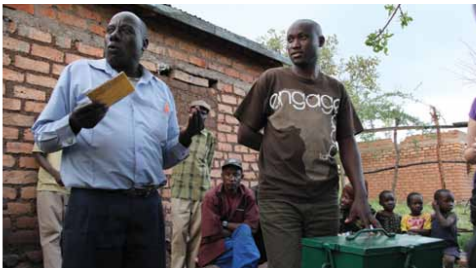
Personas votando en una mesa electoral en Tanzania.

Varios asociados de Tearfund han participado en labores para intentar evitar la violencia en torno al período electoral. La mayor