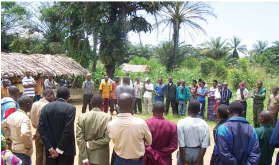
Participantes se reúnen después de una sesión de capacitación en el territorio Beni, RDC.

Uno de nuestros proyectos más exitosos es nuestro programa de radio "Peace Music" [Música para la paz] creado en el CRC de Bradford. La idea es utilizar la música como una herramienta para comunicar nuestro mensaje de paz a nuestra ciudad, pero también estamos llegando al mundo a través de Internet. No escribimos nuestra