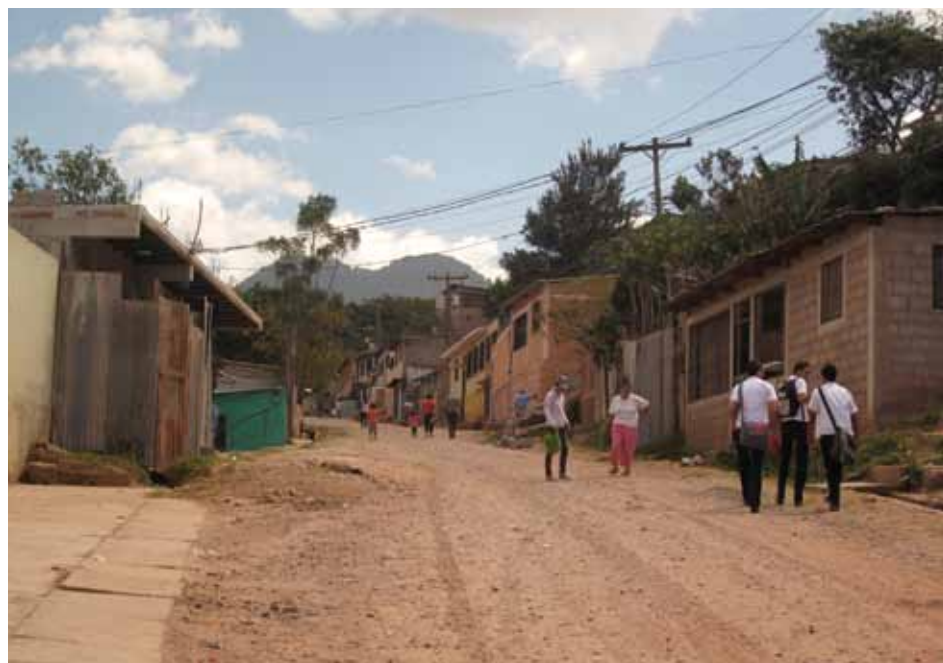
Sarah Newham / Tearfund

Muchas de las zonas con niveles altos de violencia también son empobrecidas, como esta comunidad en Tegucigalpa, la capital de Honduras.