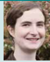
Alice Keen Editora

Todos experimentamos conflicto en nuestras vidas. Ya sea en nuestras familias, con colegas o vecinos, hay momentos en los que no estamos de acuerdo con