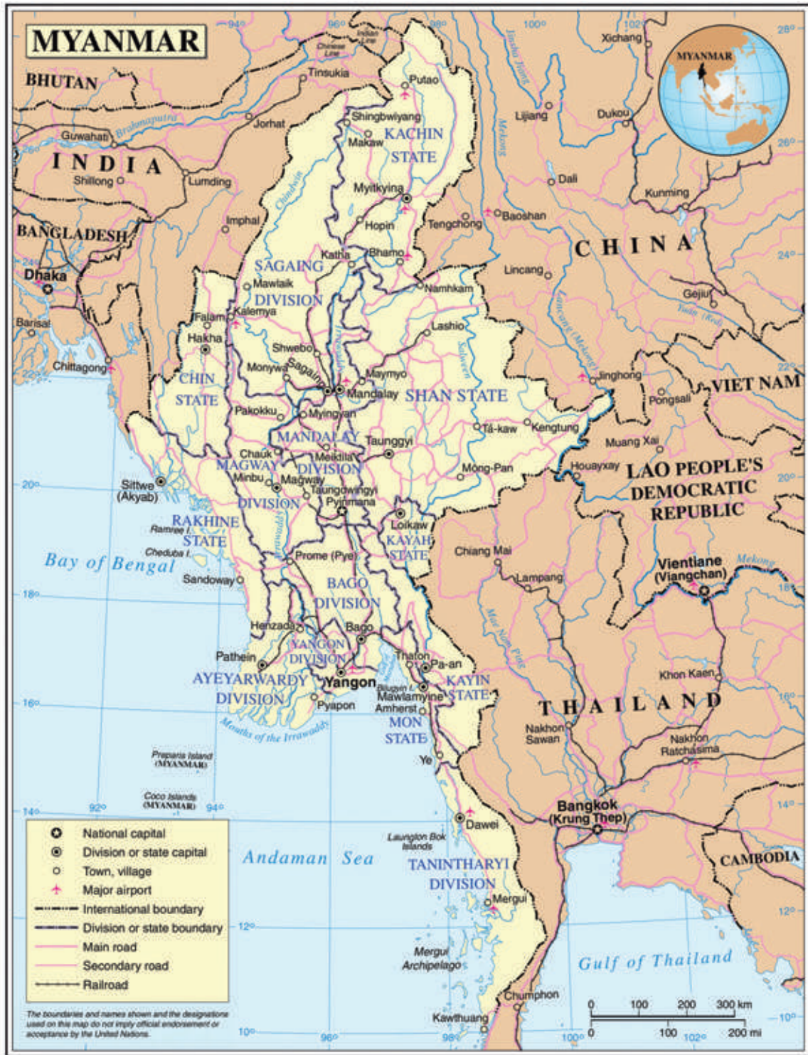
Map of Myanmar (United Nations)