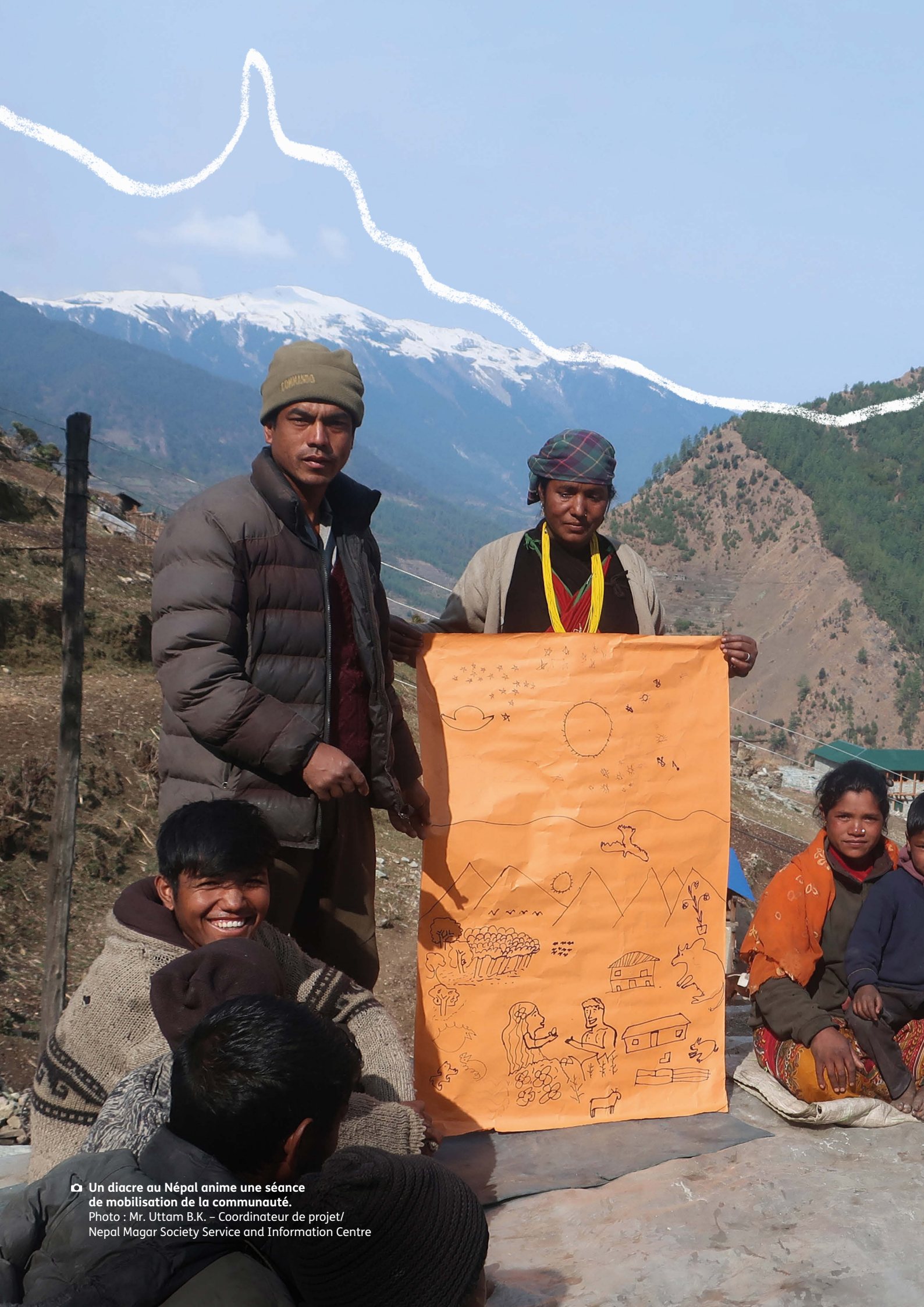
Un diacre au Népal anime une séance de mobilisation de la communauté.