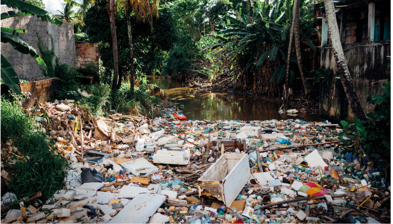
📍 Brésil, Recife, communauté de Coqueiral.