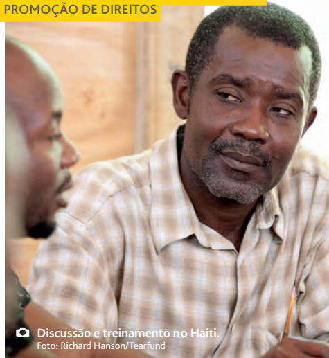
📷 Discussão e treinamento no Haiti.