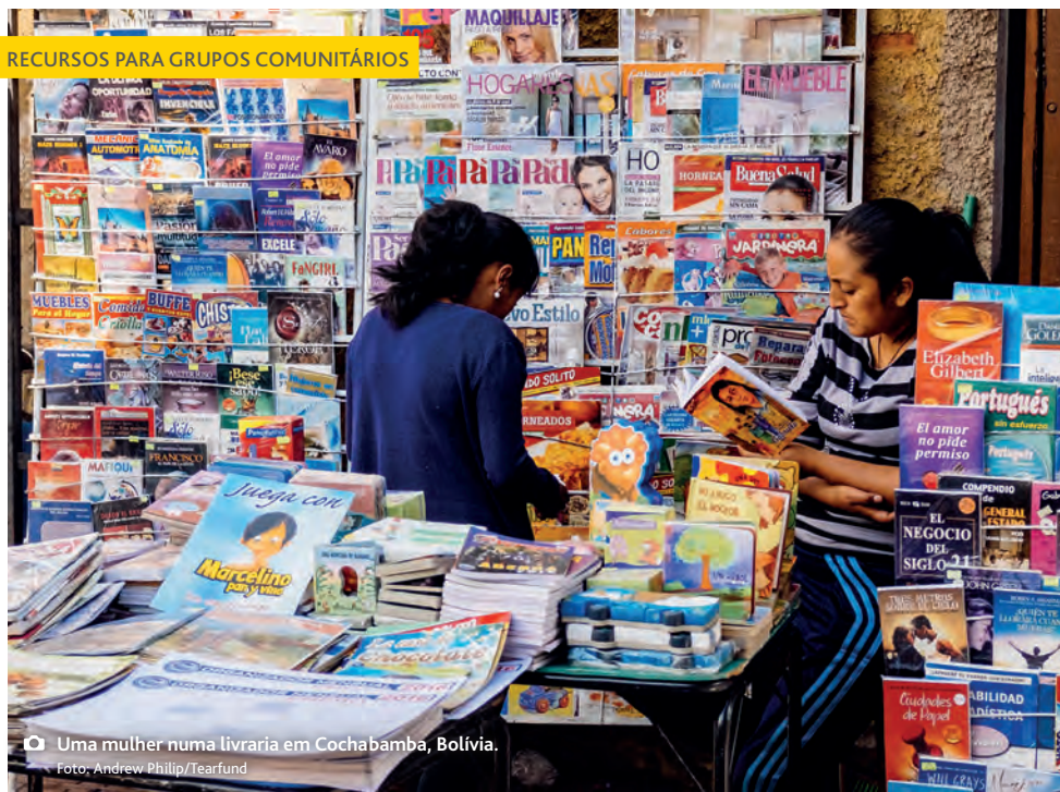
Uma mulher numa livraria em Cochabamba, Bolívia.