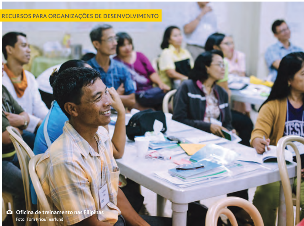
📷 Oficina de treinamento nas Filipinas