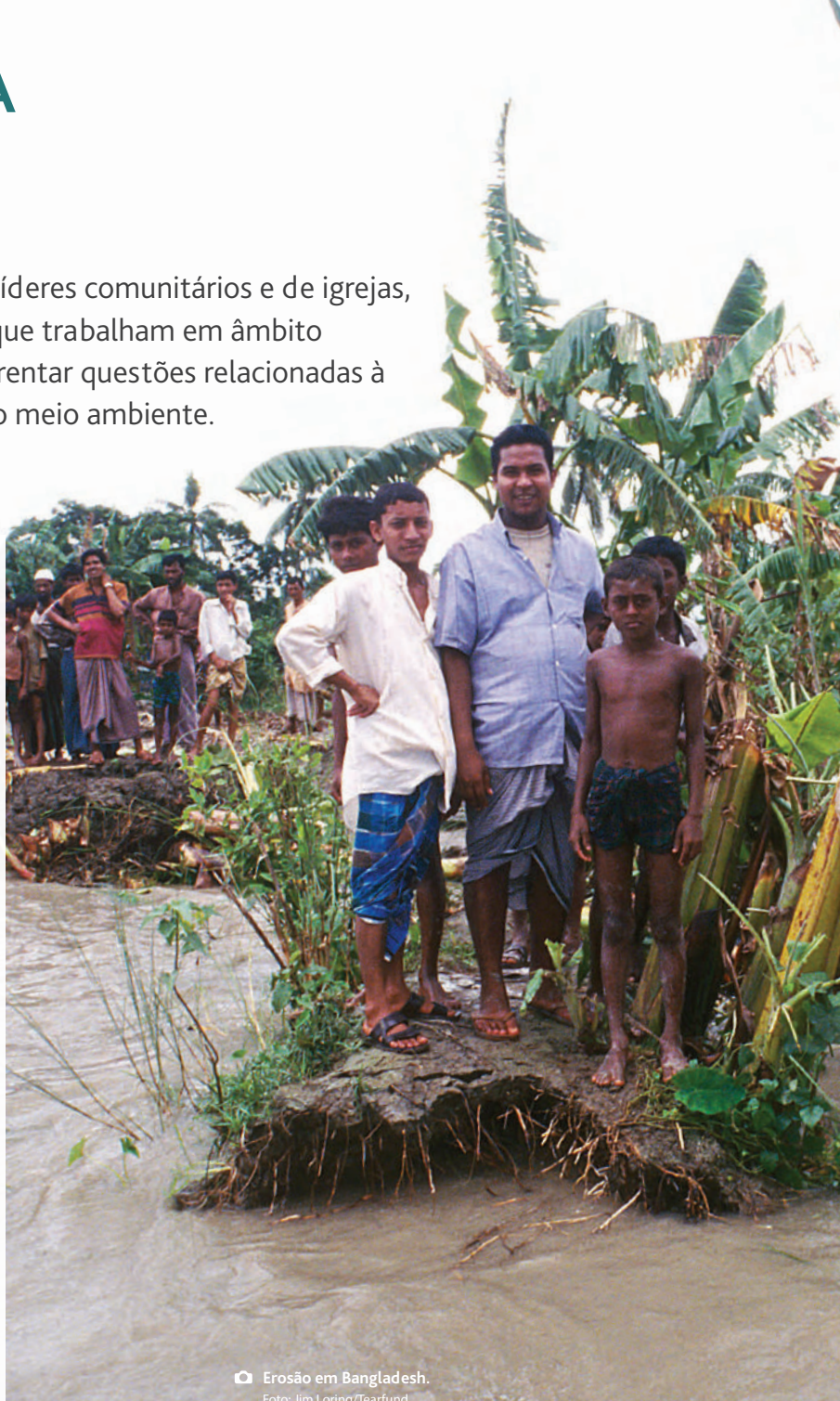
Erosão em Bangladesh.