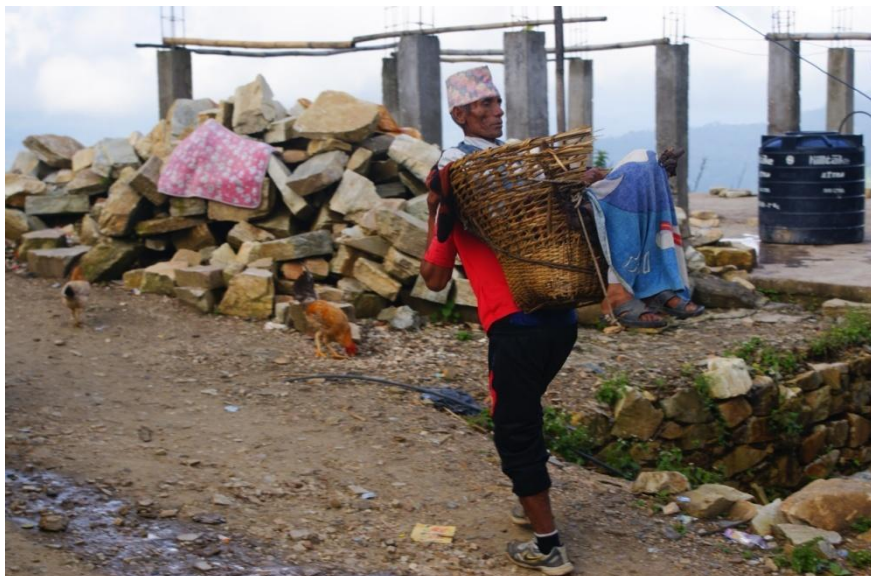
📷 Um senhor idoso recebe ajuda para chegar a um centro médico no Nepal.

Se a vacinação requerer a aplicação de duas doses para que seja eficaz, o mesmo tipo de ajuda pode ser necessário quando a pessoa regressar para tomar a segunda dose.