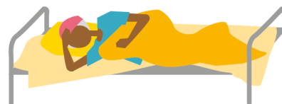
Pessoas com problemas de saúde sérios