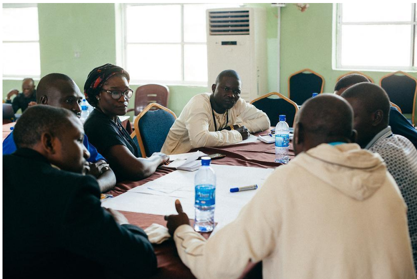
📷 Um grupo de líderes de igrejas reunidos na Nigéria.