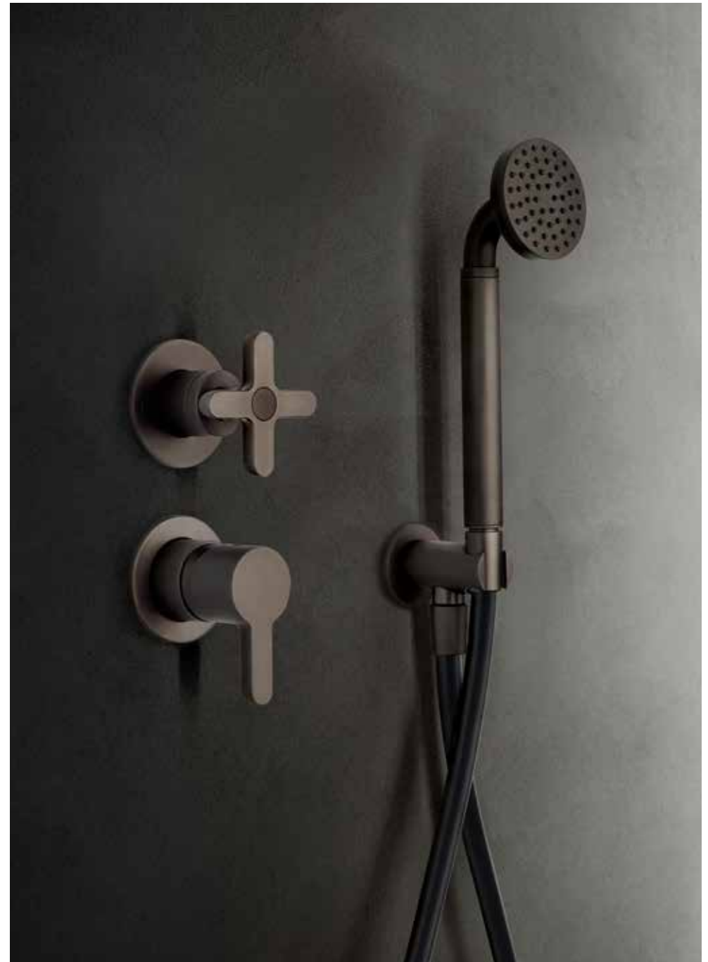
P5 R485B+M585A / P5 R043 [ MATT GUN METAL PVD ]