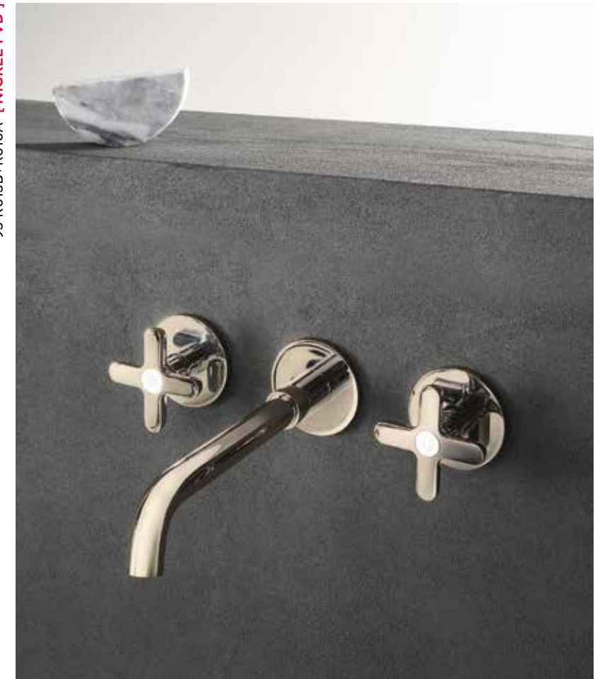
95 R013B+R010A [ NICKEL PVD ]