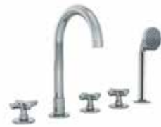
R065 Gruppo bordo vasca, interasse bocca 16 cm / Vitoni ceramici. Deck-mount bathtub mixer, spout projection 16 cm / Ceramic cartridges. Misturadora para aba de banheira, projecção da bica: 16 cm / Cartucho cerâmicos. Наборный смеситель для ванны, вылет 16 см / Керамический картридж. 缸边式浴缸龙头组, 龙头出水口长度16cm / 陶瓷阀芯. Finiture/ Finishing/ Acabamentos/ Отделки/ 漆面 02, 13, 95, P5, P6, P9, Q7, Q8