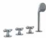
R067 Gruppo bordo vasca / Vitoni ceramici. Deck-mount bathtub mixer / Ceramic cartridges. Misturadora para aba de banheira / Cartucho cerâmicos. Наборный смеситель для ванны / Керамический картридж. 缸边式浴缸龙头组 / 陶瓷阀芯. Finiture/ Finishing/ Acabamentos/ Отделки/ 漆面 02, 13, 95, P5, P6, P9, Q7, Q8