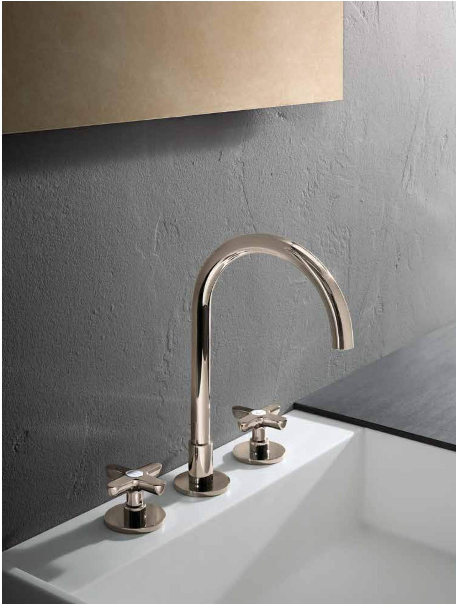
95 R007 [ NICKEL PVD ]