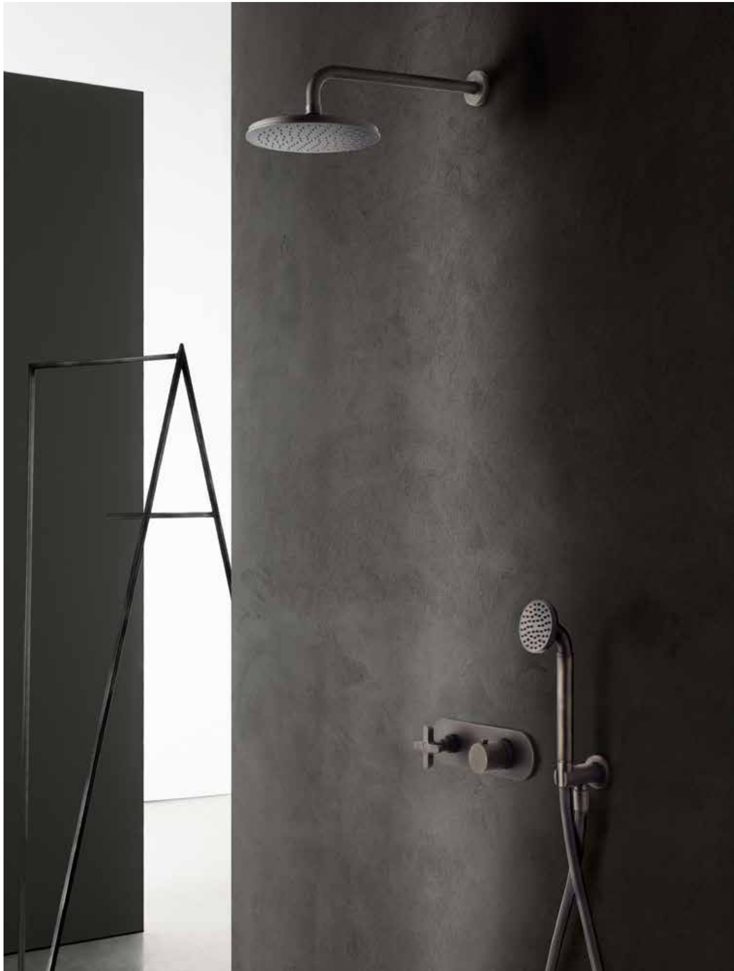
P5 8027 / P5 8113 / P5 R772B+D372A / P5 R043 [ MATT GUN METAL PVD ]