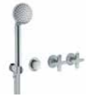
R017B+R017A Gruppo vasca/doccia incasso / Vitoni ceramici. Built-in bathtub/shower mixer / Ceramic cartridges. Misturadora embutida para banheira/duche / Cartucho cerâmicos. Встроенный смеситель для ванны/душа / Керамический картридж. 预埋式浴缸龙头 / 陶瓷阀芯. Finiture/ Finishing/ Acabamentos/ Отделки/ 漆面 02, 13, 95, P5, P6, P9, Q7, Q8