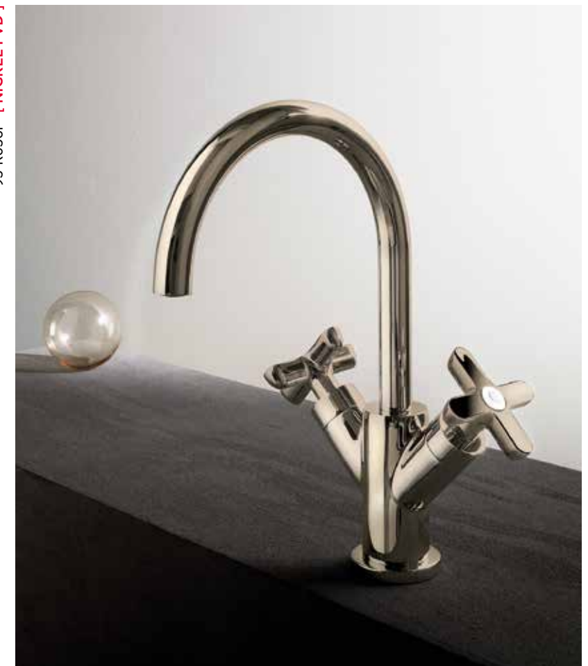
95 R056F [ NICKEL PVD ]