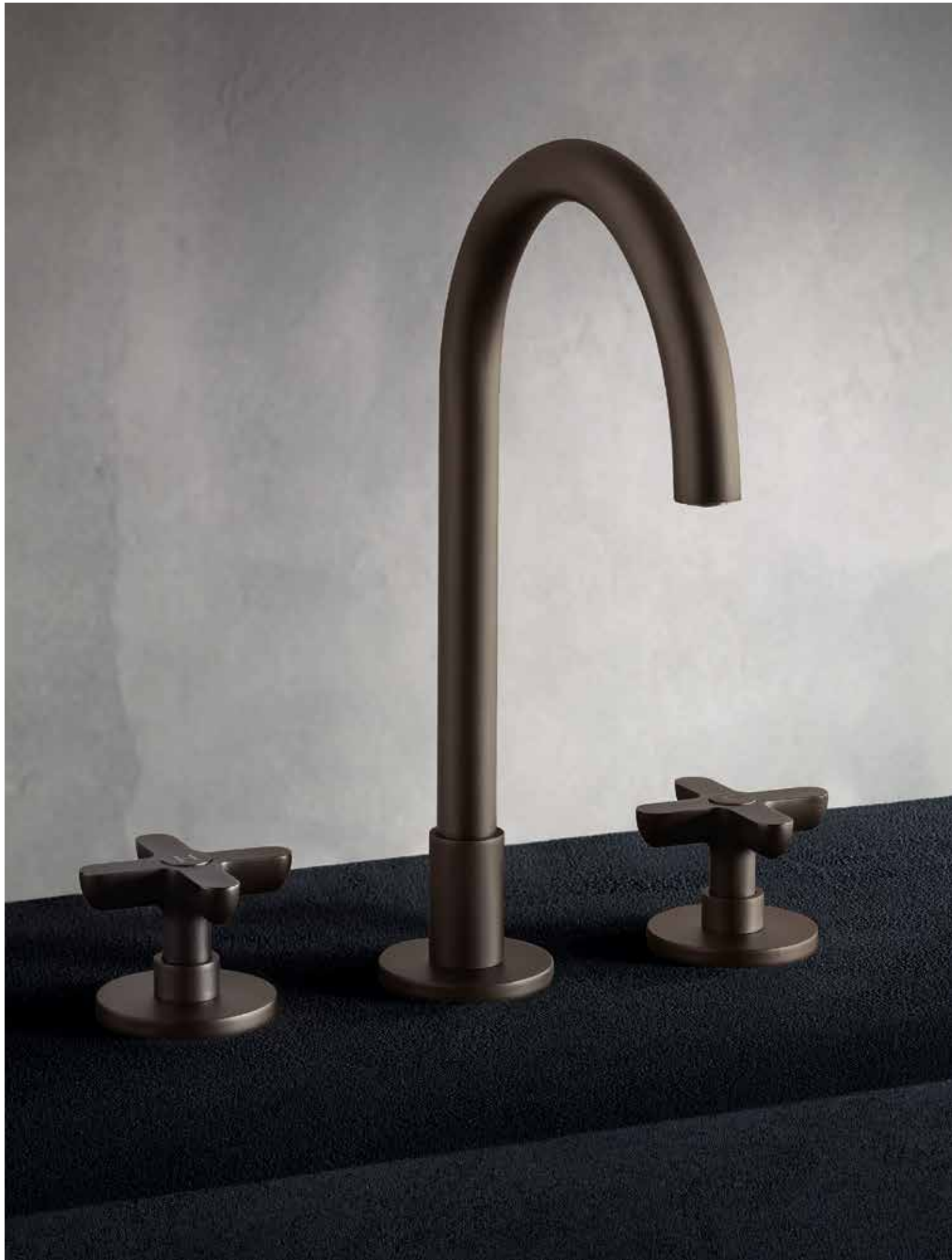
P5 R007 [ MATT GUN METAL PVD ]