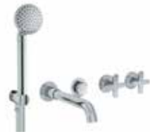
R019B+R019A Gruppo vasca incasso, interasse bocca 20 cm / Vitoni ceramici. Built-in bathtub mixer, spout projection 20 cm / Ceramic cartridges. Misturadora embutida para banheira, projecção da bica: 20 cm / Cartucho cerâmicos. Встраиваемый смеситель для ванны, вылет 20 см / Керамический картридж. 预埋式浴缸龙头, 龙头出水口长度20cm / 陶瓷阀芯. Finiture/ Finishing/ Acabamentos/ Отделки/ 漆面 02, 13, 95, P5, P6, P9, Q7, Q8