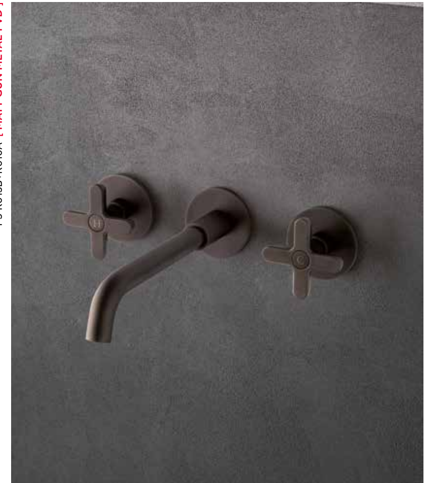
P5 R013B+R010A [ MATT GUN METAL PVD ]