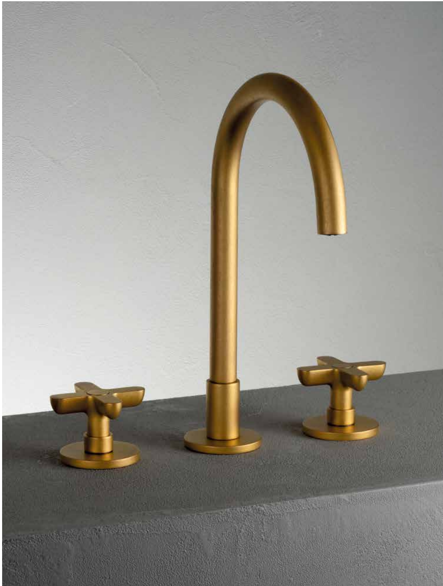
Q7 R007 [ PURE BRASS PVD ]