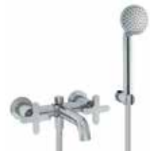
R015 Gruppo vasca esterno, interasse bocca 15,4 cm / Vitoni ceramici. Wall-mount bathtub mixer, spout projection 15,4 cm / Ceramic cartridges. Misturadora de parede para banheira, projecção da bica: 15,4 cm / Cartucho cerâmicos. Смеситель из стены для ванны, вылет 15,4 см / Керамический картридж. 墙装浴缸龙头组, 龙头出水口长度15,4cm / 陶瓷阀芯. Finiture/ Finishing/ Acabamentos/ Отделки/ 漆面 02, 13, 95, P5, P6, P9, Q7, Q8