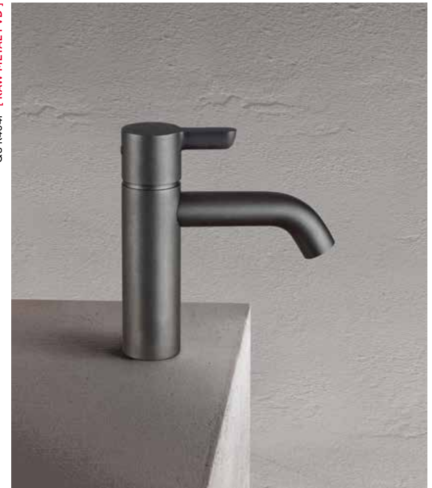
Q8 R404F [ RAW METAL PVD ]