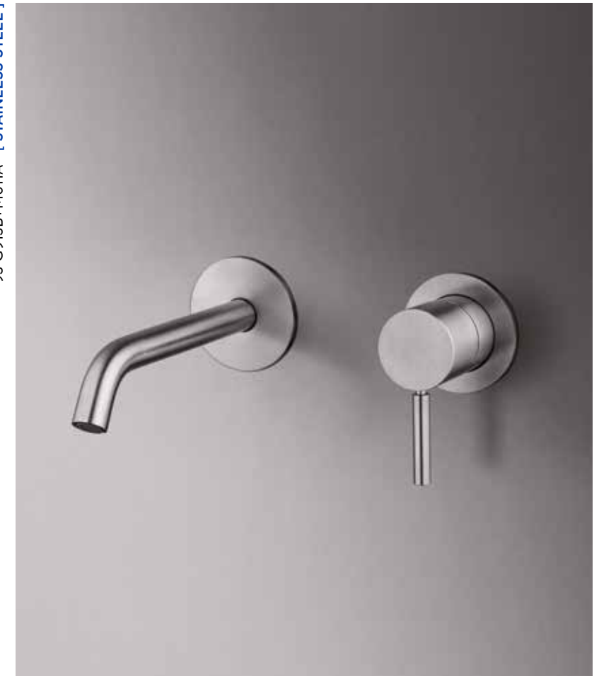
93 G913B+M011A [ STAINLESS STEEL ]