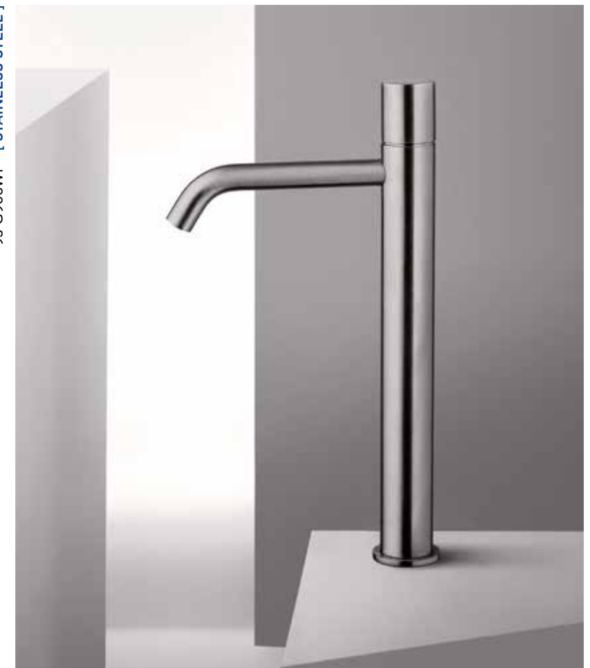
93 G906WF [ STAINLESS STEEL ]