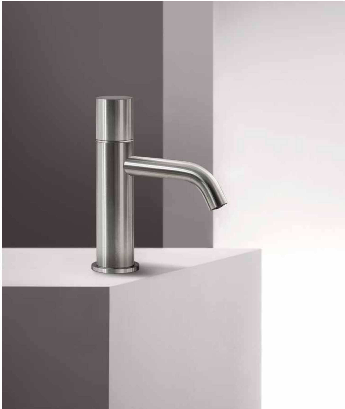
93 G904WF [ STAINLESS STEEL ]