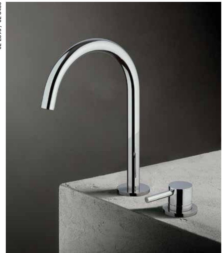
02 E895 / 02 8436