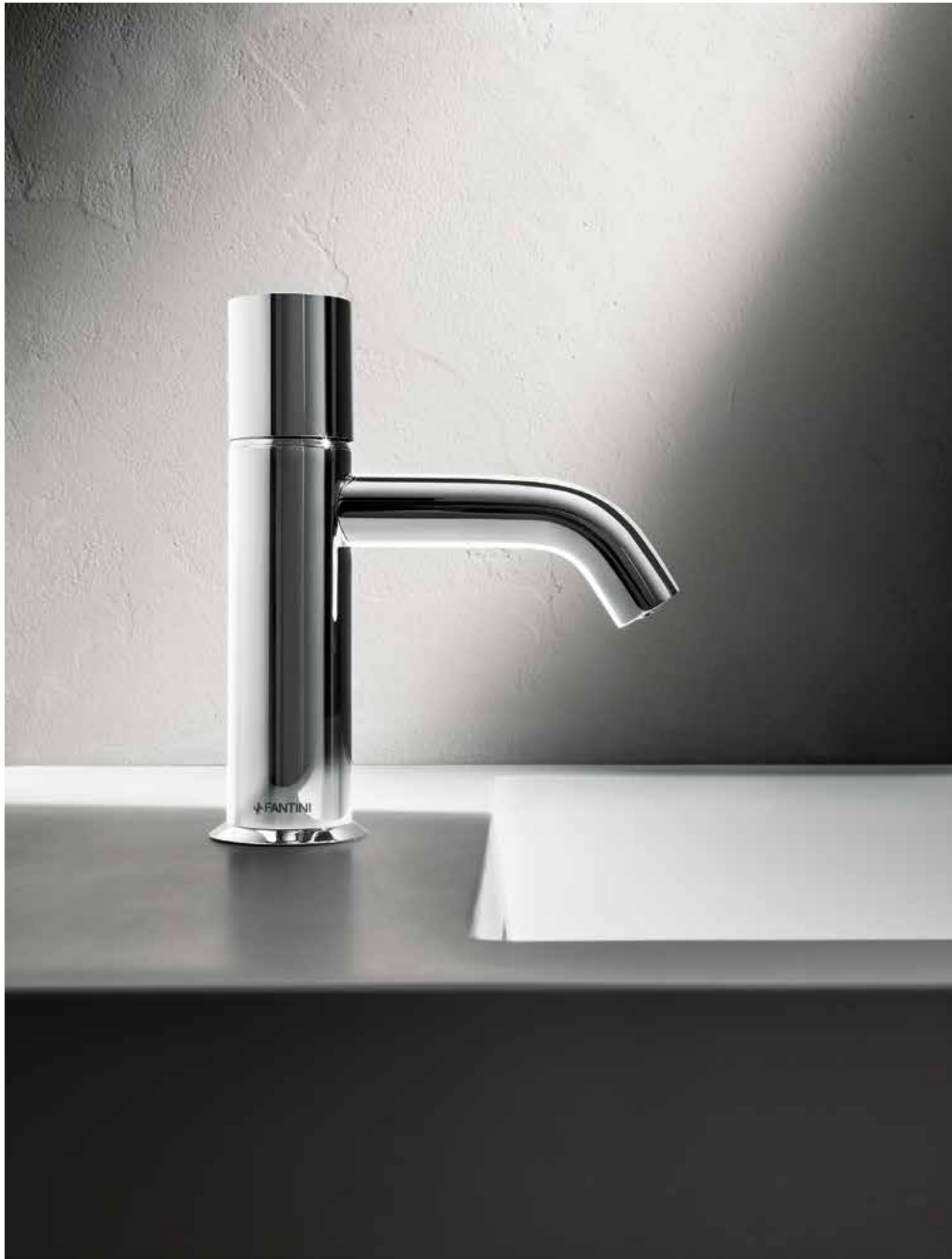
02 E904WF 02 2504WF [ ELECTRONIC ]