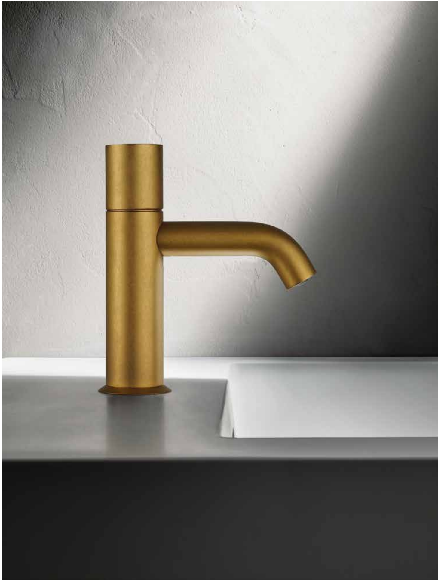
Q7 E904WF [ PURE BRASS PVD ]