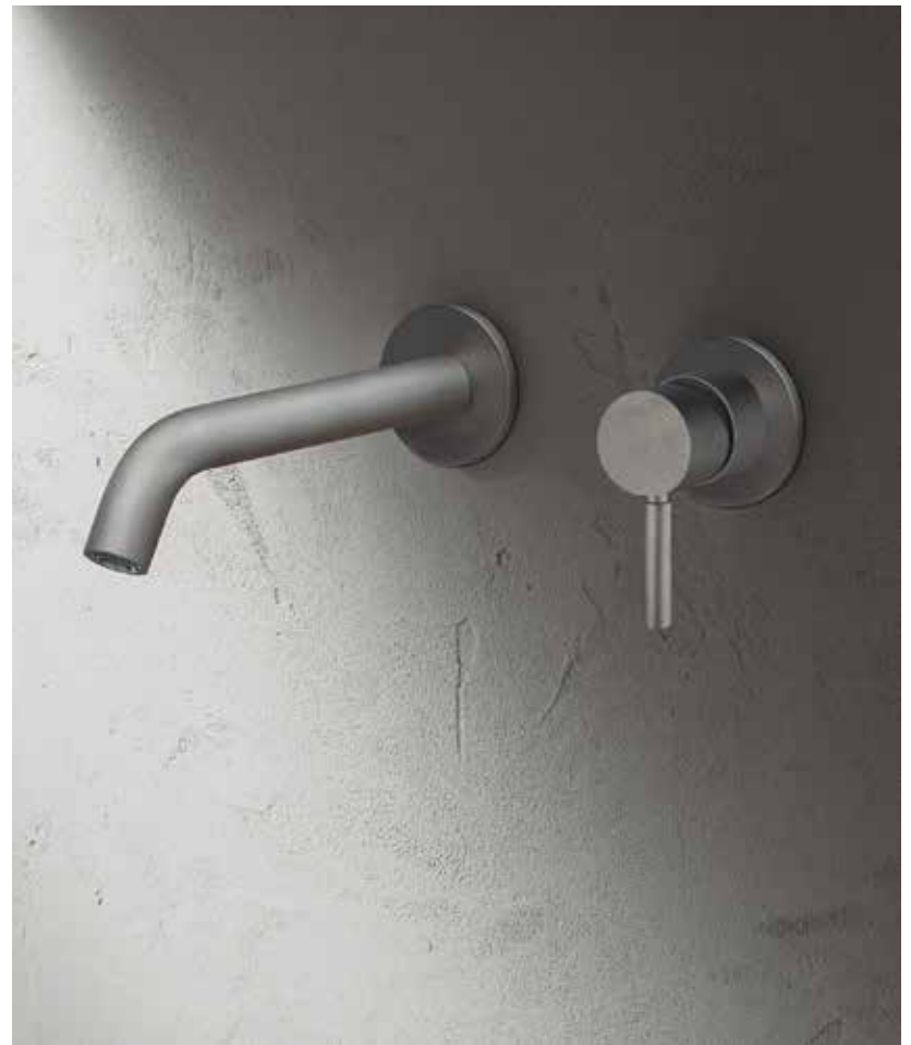
Q8 E811B+M011A [ RAW METAL PVD ]