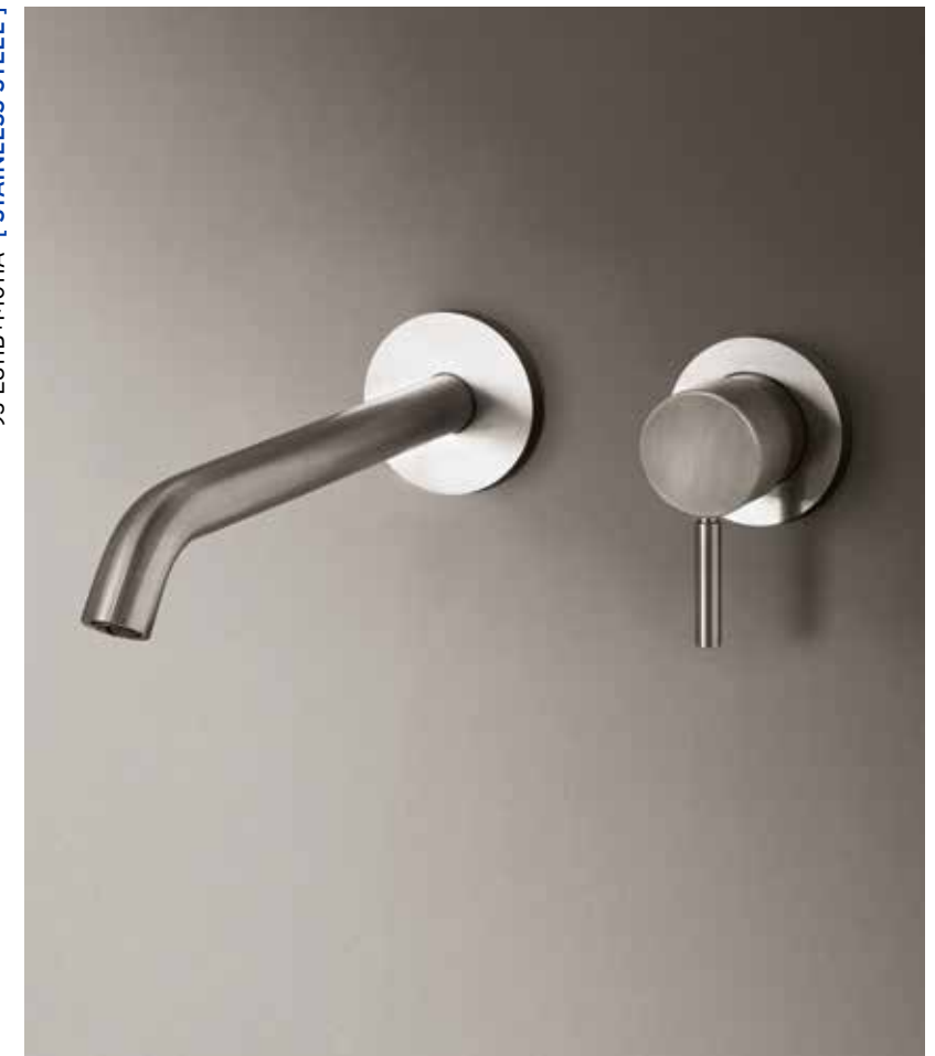
93 E811B+M011A [ STAINLESS STEEL ]