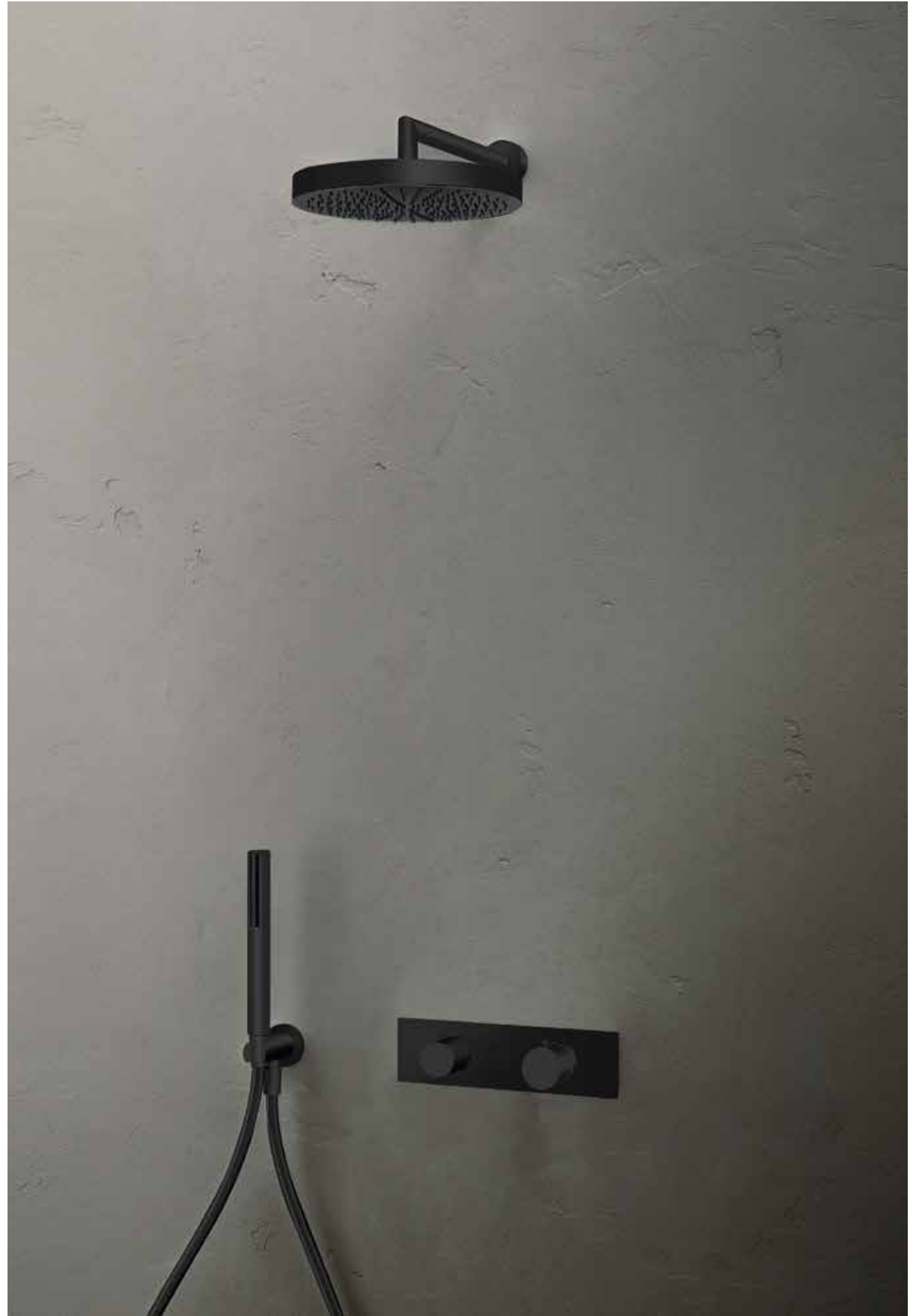
13 8083 / 13 9231 / 13 G572B+D372A / 13 8051