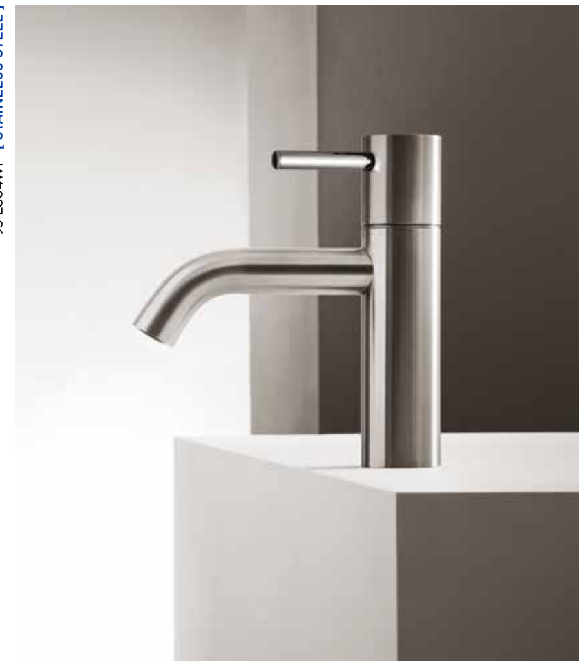
93 E804WF [ STAINLESS STEEL ]