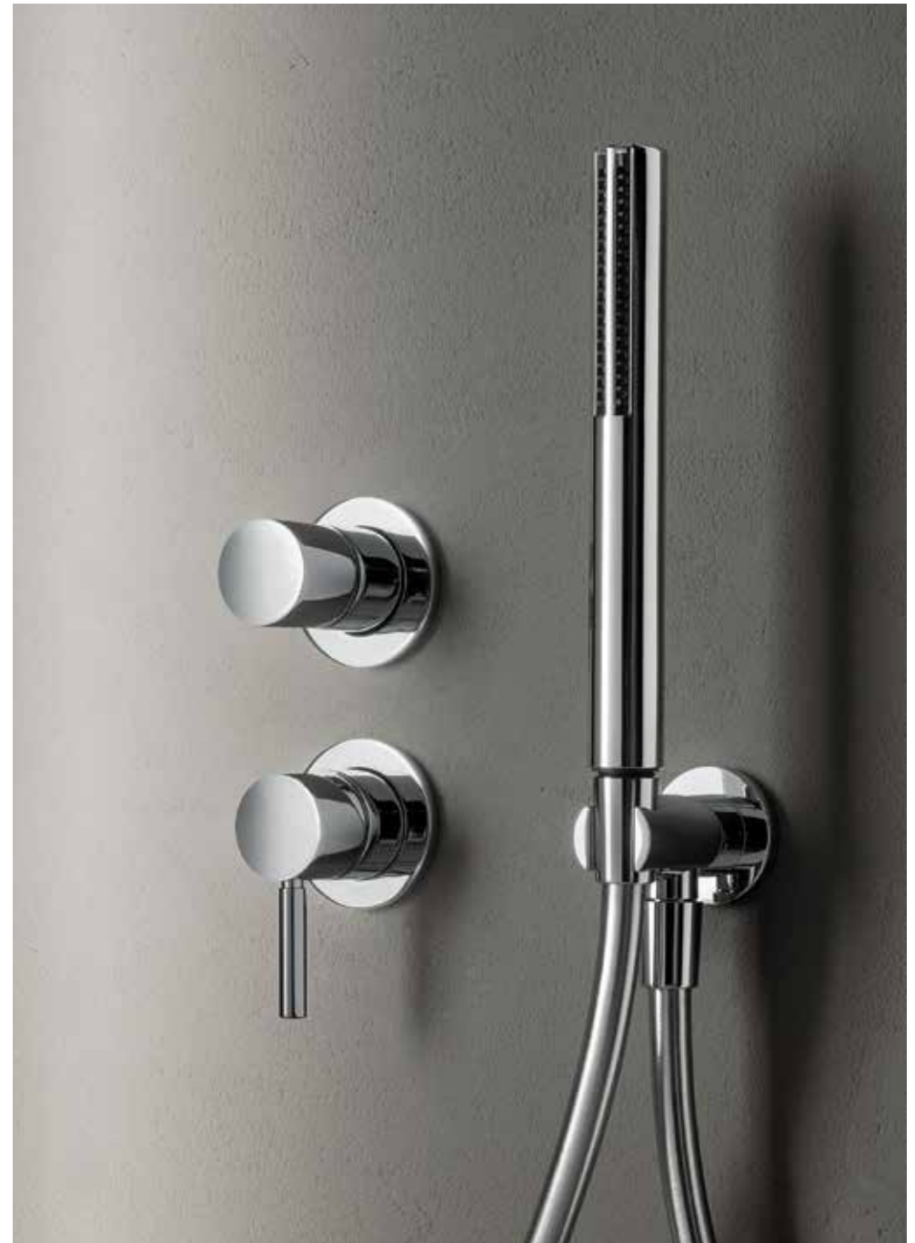
02 G481B+M585A / 02 8051