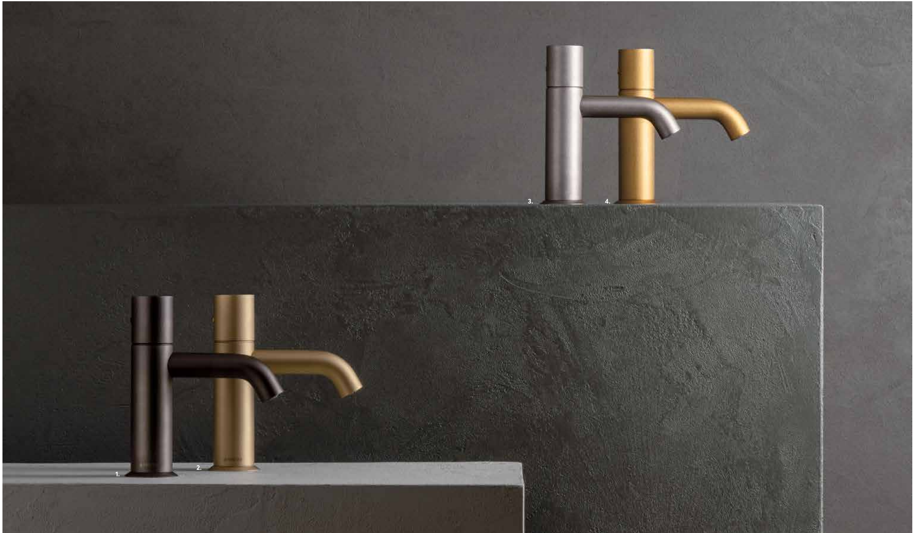
[ 1. P5 MATT GUN METAL PVD 2. P6 MATT BRITISH GOLD PVD 3. Q8 RAW METAL PVD 4. Q7 PURE BRASS PVD ]