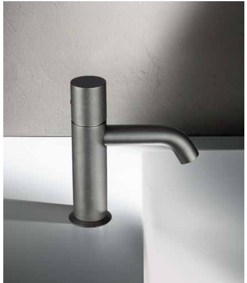
Q8 E906WF [ RAW METAL PVD ]