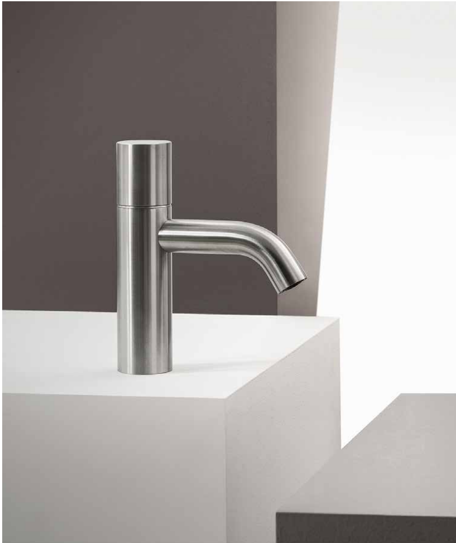
93 E904WF [ STAINLESS STEEL ]