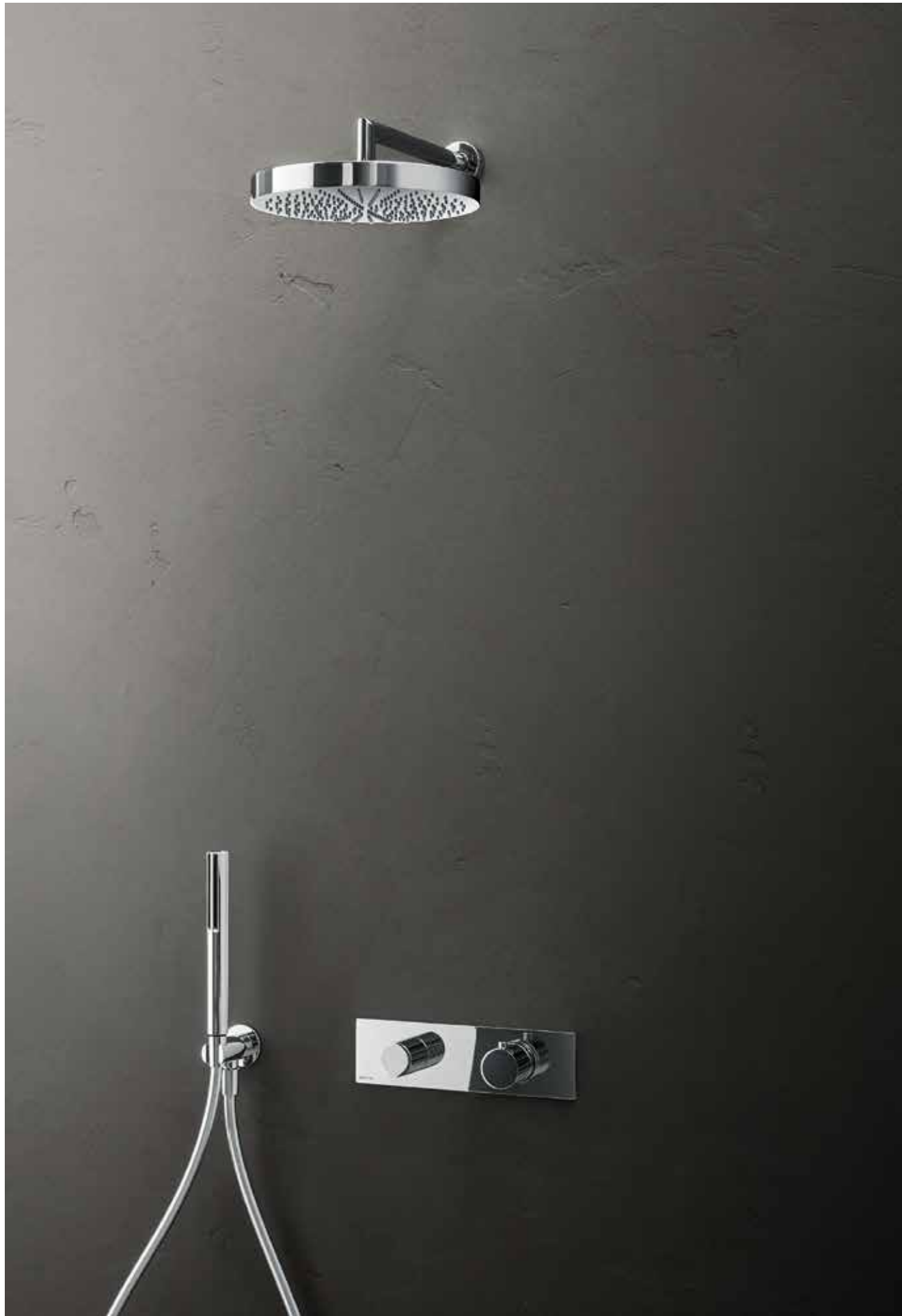
02 9231 / 02 8083 / 02 G572B+D372A / 02 8051