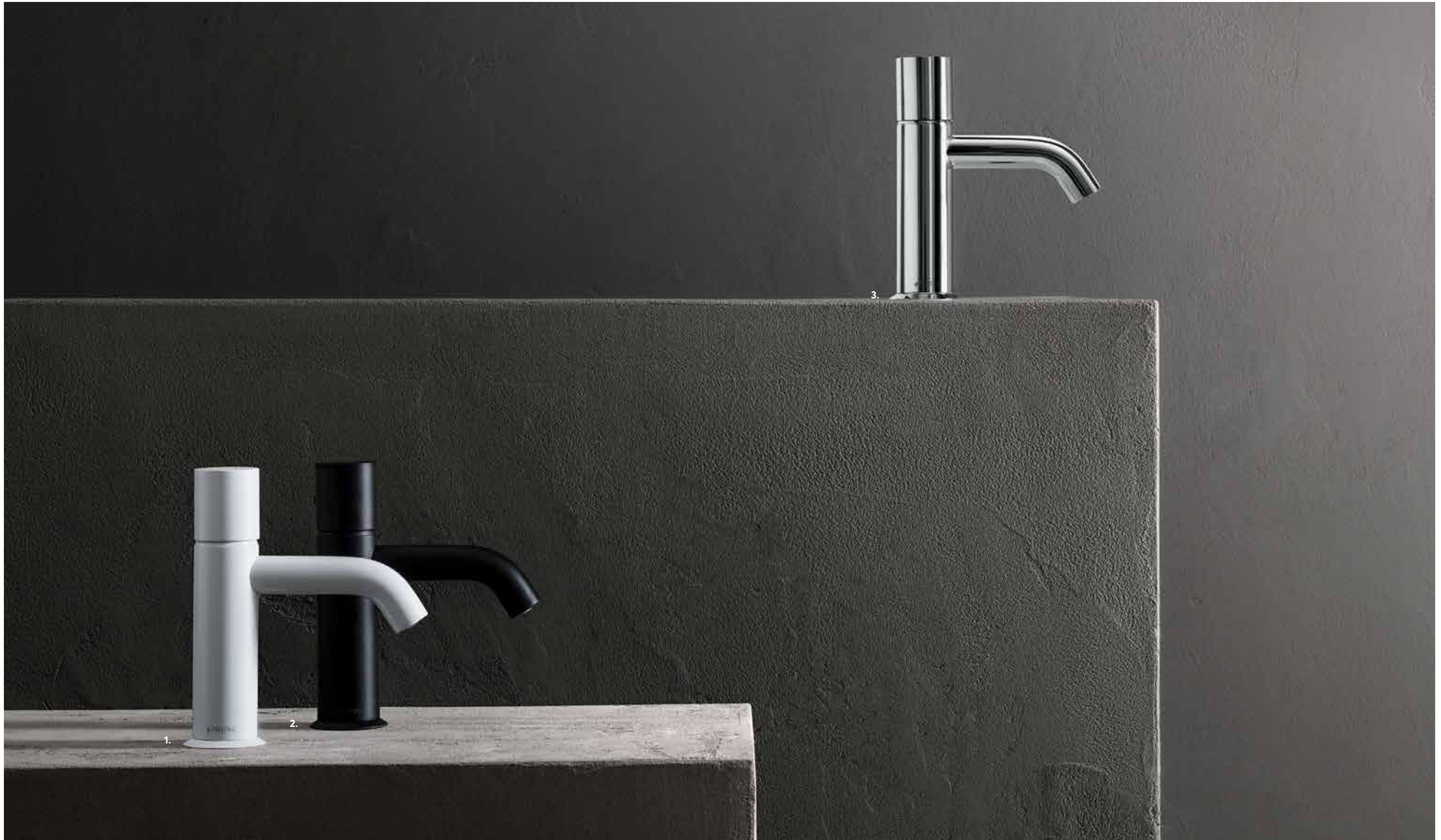
[ 1. 29 BIANCO OPACO 2. 13 NERO OPACO 3. 02 CROMO ]