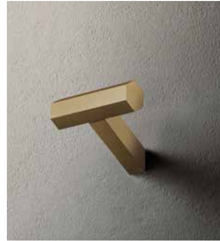
P6 7808 [ MATT BRITISH GOLD PVD ]