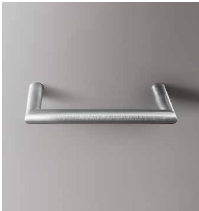
93 7609 [ STAINLESS STEEL ]