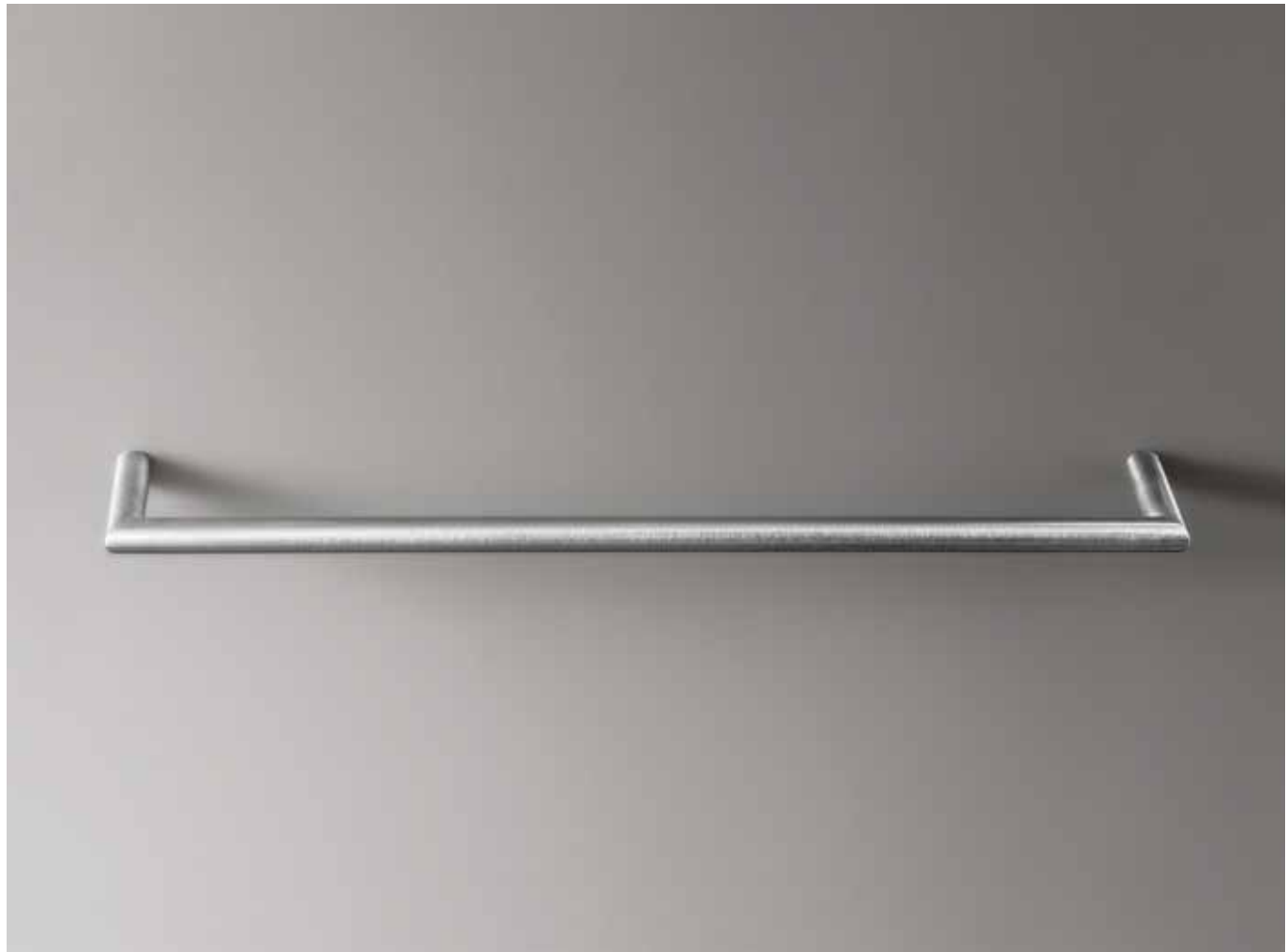
93 7611 [ STAINLESS STEEL ]