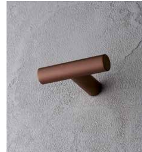
P9 7608 [ MATT COPPER PVD ]