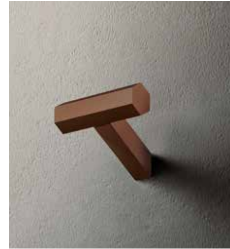
P9 7808 [ MATT COPPER PVD ]