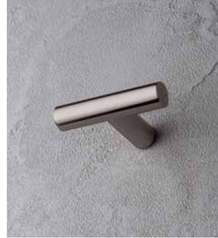
95 7608 [ NICKEL PVD ]