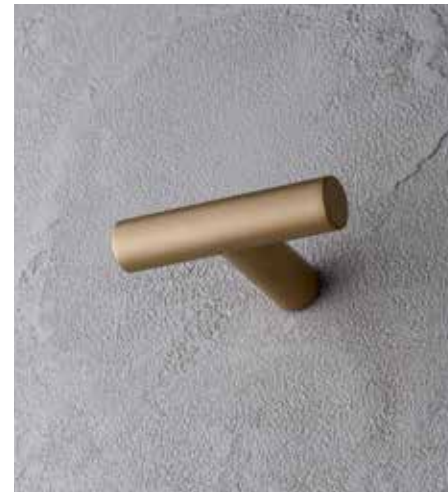
P6 7608 [ MATT BRITISH GOLD PVD ]