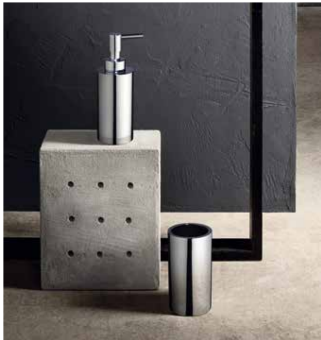
02 7652 / 02 7650