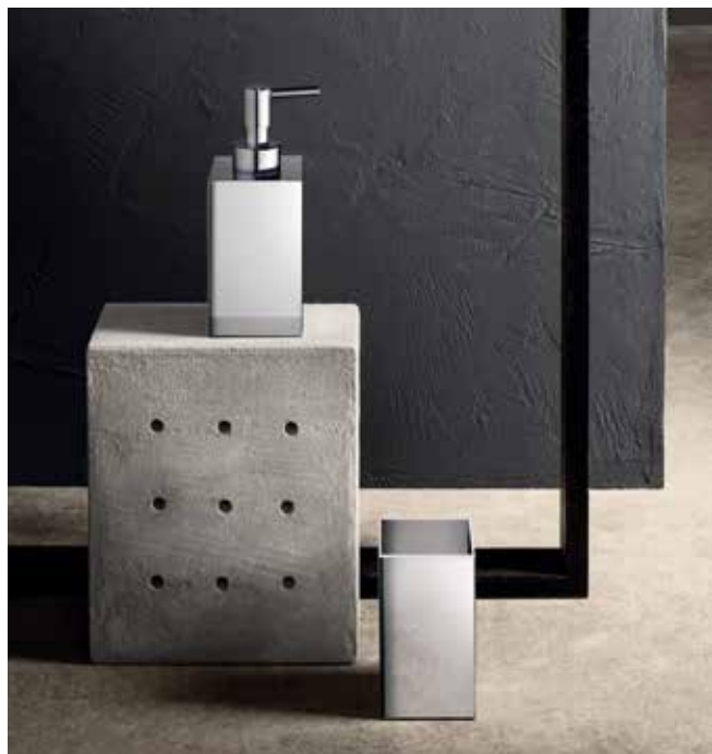
02 7752 / 02 7750