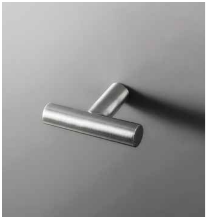
93 7608 [ STAINLESS STEEL ]