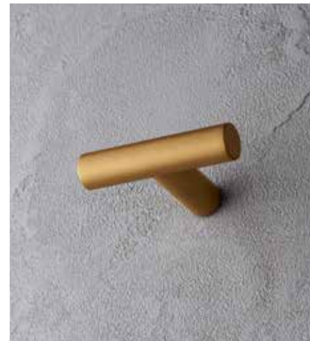
Q7 7608 [ PURE BRASS PVD ]