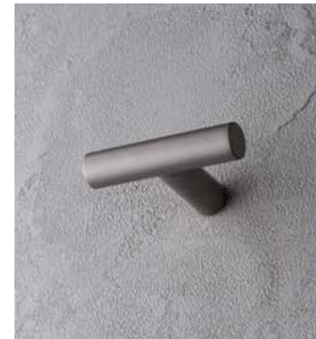
Q8 7608 [ RAW METAL PVD ]