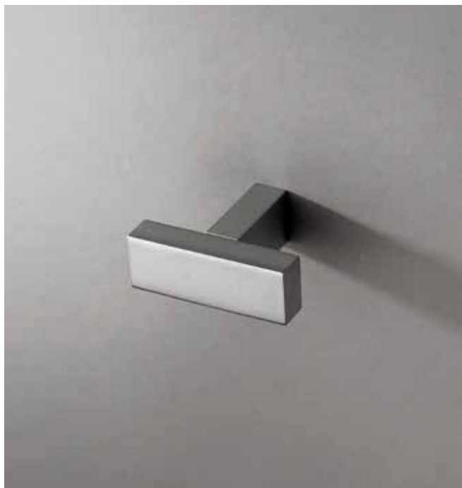
93 7708 [ STAINLESS STEEL ]