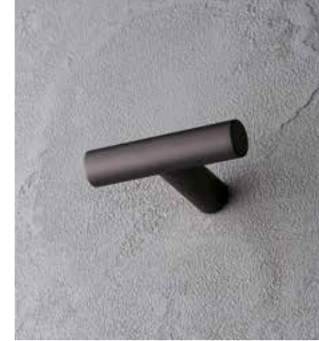
P5 7608 [ MATT GUN METAL PVD ]