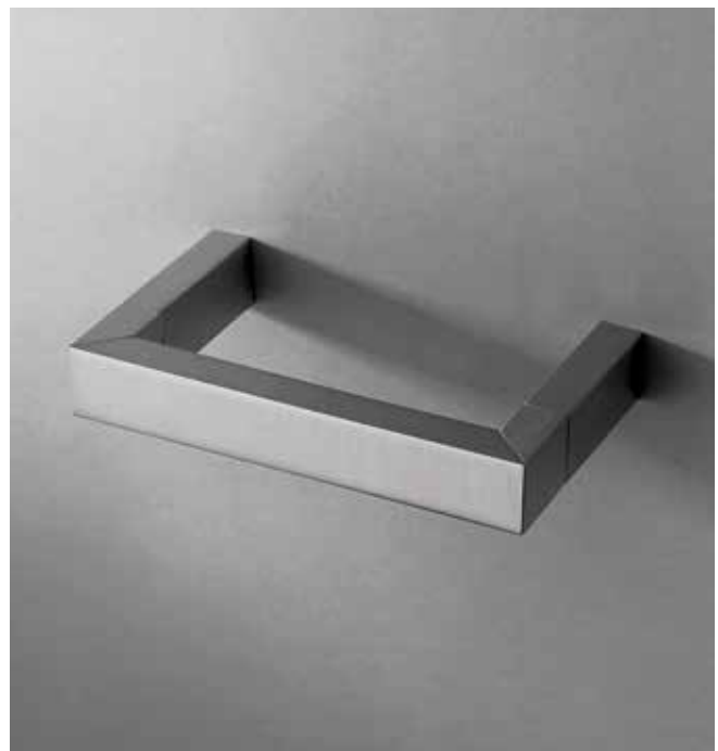
93 7709 [ STAINLESS STEEL ]