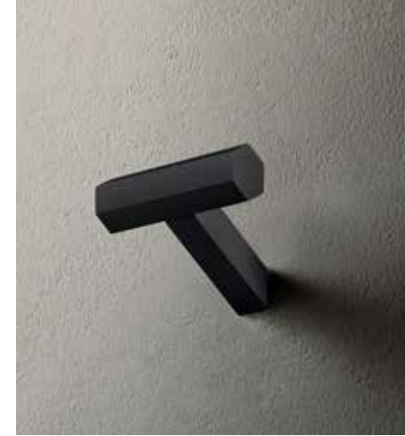
P5 7808 [ MATT GUN METAL PVD ]