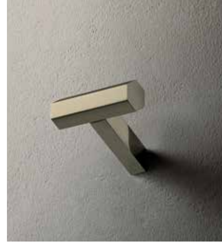
95 7808 [ NICKEL PVD ]