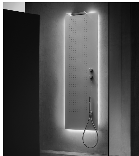
Многофункциональная душевая панель полувстроенная стр. 9