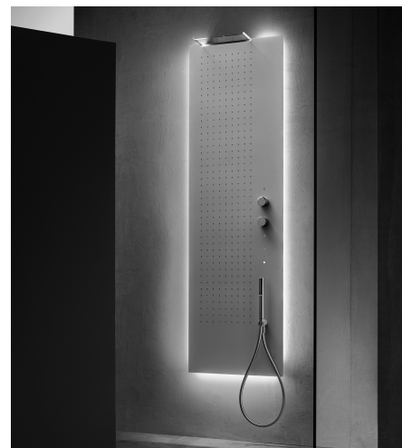
Columna ducha multifunción SEMI-EMPOTRADA Pág. 9