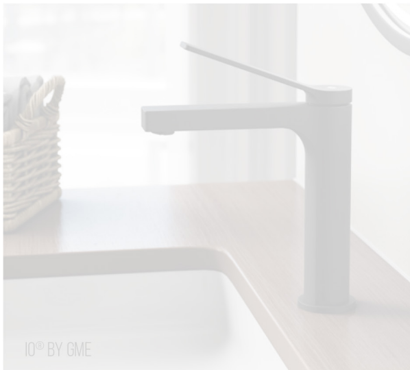
IO® BY GME