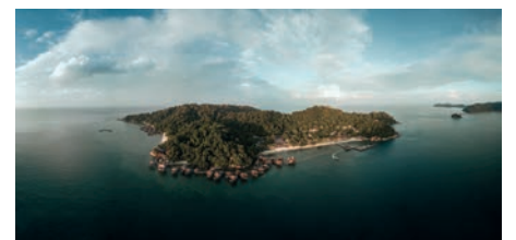
Option I: Pangkor Laut Resort