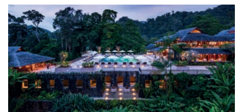
Option II: The Datai Langkawi