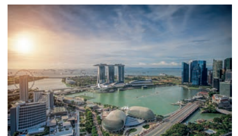
Verlängerung in Singapur