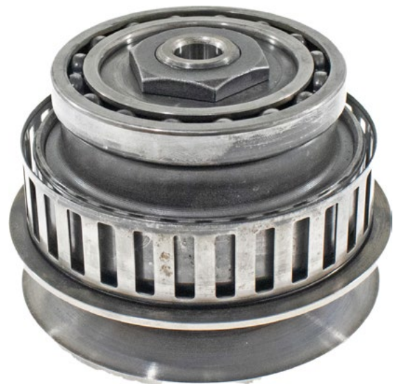
Ensamble de la pulea Secundaria

INGENIADO PARA RENDIMIENTO. DISEÑADO PARA DURABILIDAD.