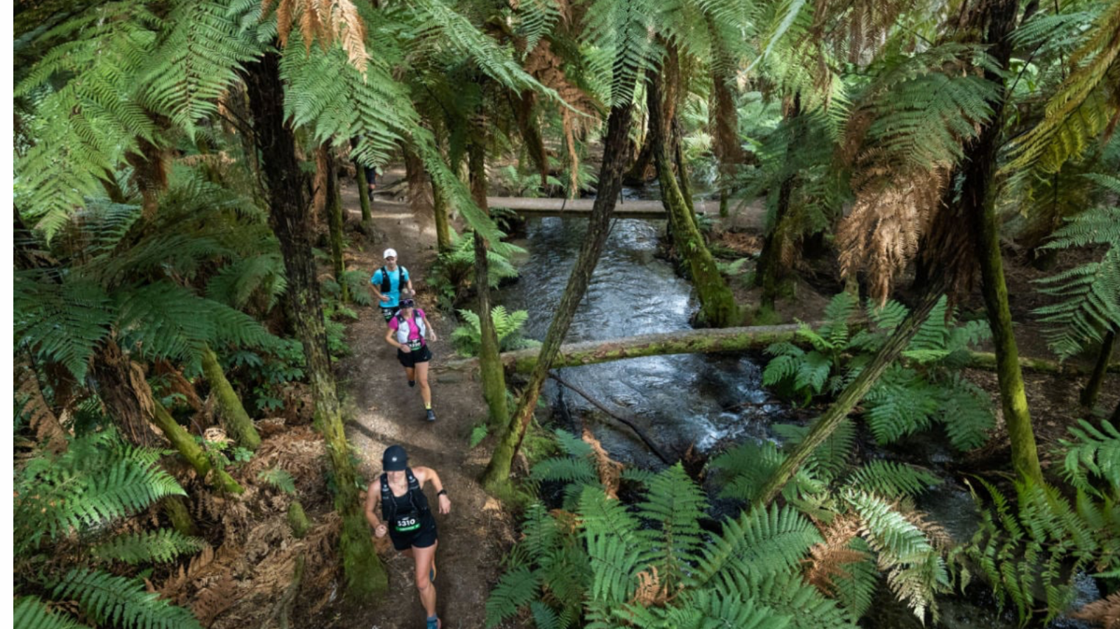
Tarawera Ultra-Trail by UTMB - foto en alta resolución