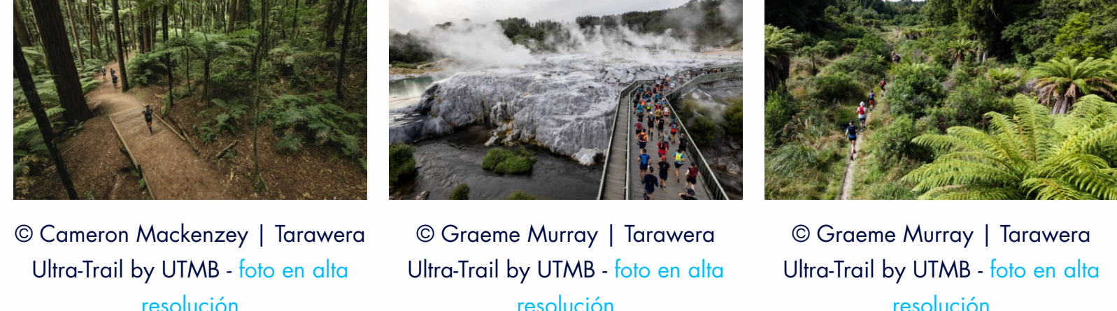
© Cameron Mackenzie | Tarawera Ultra-Trail by UTMB - foto en alta resolución | © Graeme Murray | Tarawera Ultra-Trail by UTMB - foto en alta resolución | © Graeme Murray | Tarawera Ultra-Trail by UTMB - foto en alta resolución