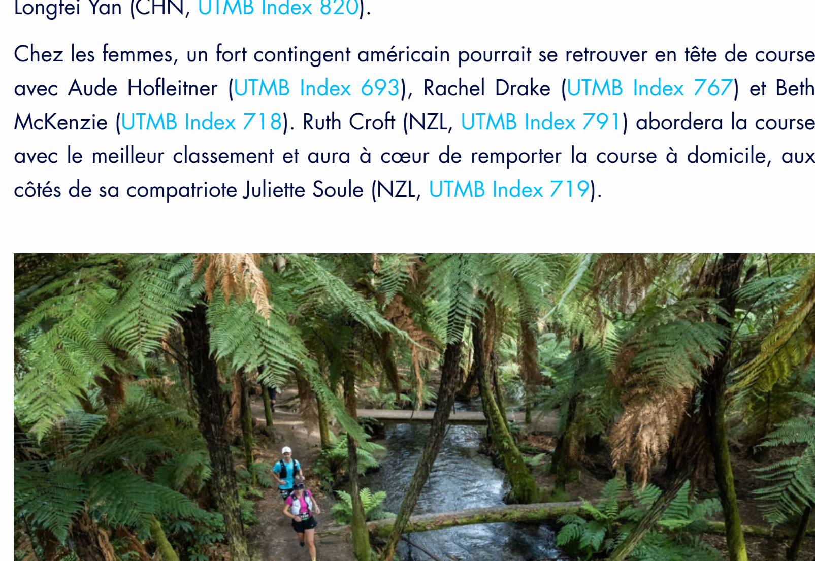
Tarawera Ultra-Trail by UTMB - photo en haute résolution