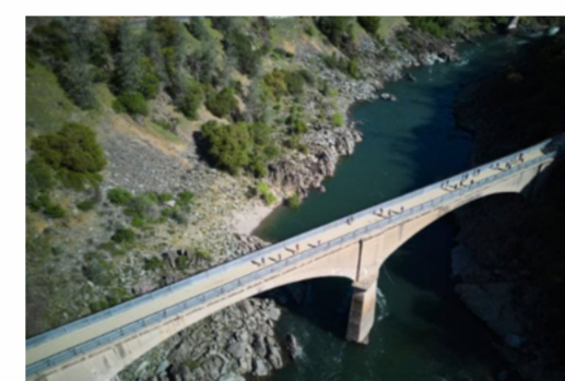
photo en haute résolution