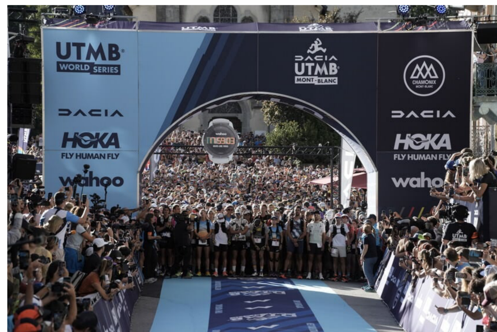
Dacia UTMB Mont-Blanc 2023 - Départ de la course UTMB

Si ce dispositif de promotion et de diffusion permet au trail running de rayonner auprès d'un large public en France, il assure également aux fans de la discipline de vibrer à nouveau devant les exploits de leurs coureurs favoris, sur leurs différentes destinations des UTMB World Series à travers le monde.