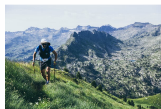
photo en haute résolution