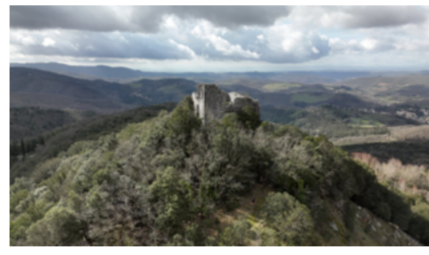
Chianti Ultra Trail by UTMB