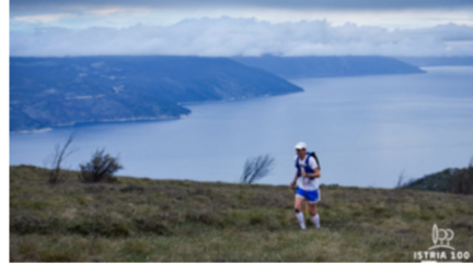
Istria 100 by UTMB