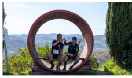
Chianti Ultra Trail by UTMB