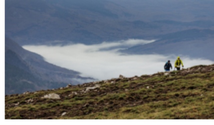
Istria 100 by UTMB

In quanto evento del circuito delle UTMB World Series, i finisher di ciascuna categoria UTMB otterranno le Running Stones per partecipare alla finalissima delle UTMB World Series. I primi 3 classificati uomo e donna delle categorie 50K, 100K e 100M si aggiudicano di diritto un posto alle UTMB World Series Finals.