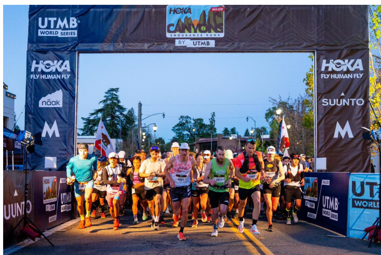
© UTMB - foto en alta resolución

Más de 2.500 corredores y un elenco de élite internacional incendiaron los senderos de Auburn en el 10º Aniversario del HOKA Canyons Endurance Runs™ by UTMB®, celebrado los días 26 y 27 de abril, dando el pistoletazo de salida a lo grande a la primera UTMB® World Series Major de 2024.