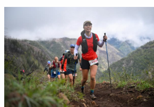
© UTMB - foto en alta resolución