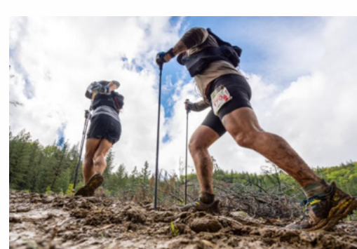
foto en alta resolución

El dominio estadounidense continuó en la carrera de 20K, con Talon Hull (EE.UU., UTMB Index 830 ) y Bailey Cossentine (EE.UU.) llevándose la cinta.