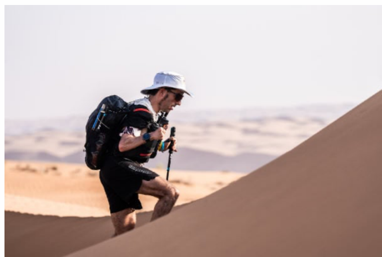
Pol Makuri Redolat © ianconrless - foto ad alta risoluzione

In ogni punto di ristoro sono previsti posti a sedere per garantire il loro comfort. Inoltre, l'organizzazione sta mettendo a punto una politica di qualificazione diretta per le finali delle UTMB® World Series - UTMB®, CCC® e OCC - dedicata ai concorrenti con disabilità, riconoscendo le maggiori difficoltà che possono incontrare nell'accumulare i requisiti di qualificazione necessari: i corridori con disabilità, in possesso di almeno 1 Running Stone e di un UTMB Index valido, potranno richiedere di bypassare il sorteggio e di qualificarsi direttamente per le finali.