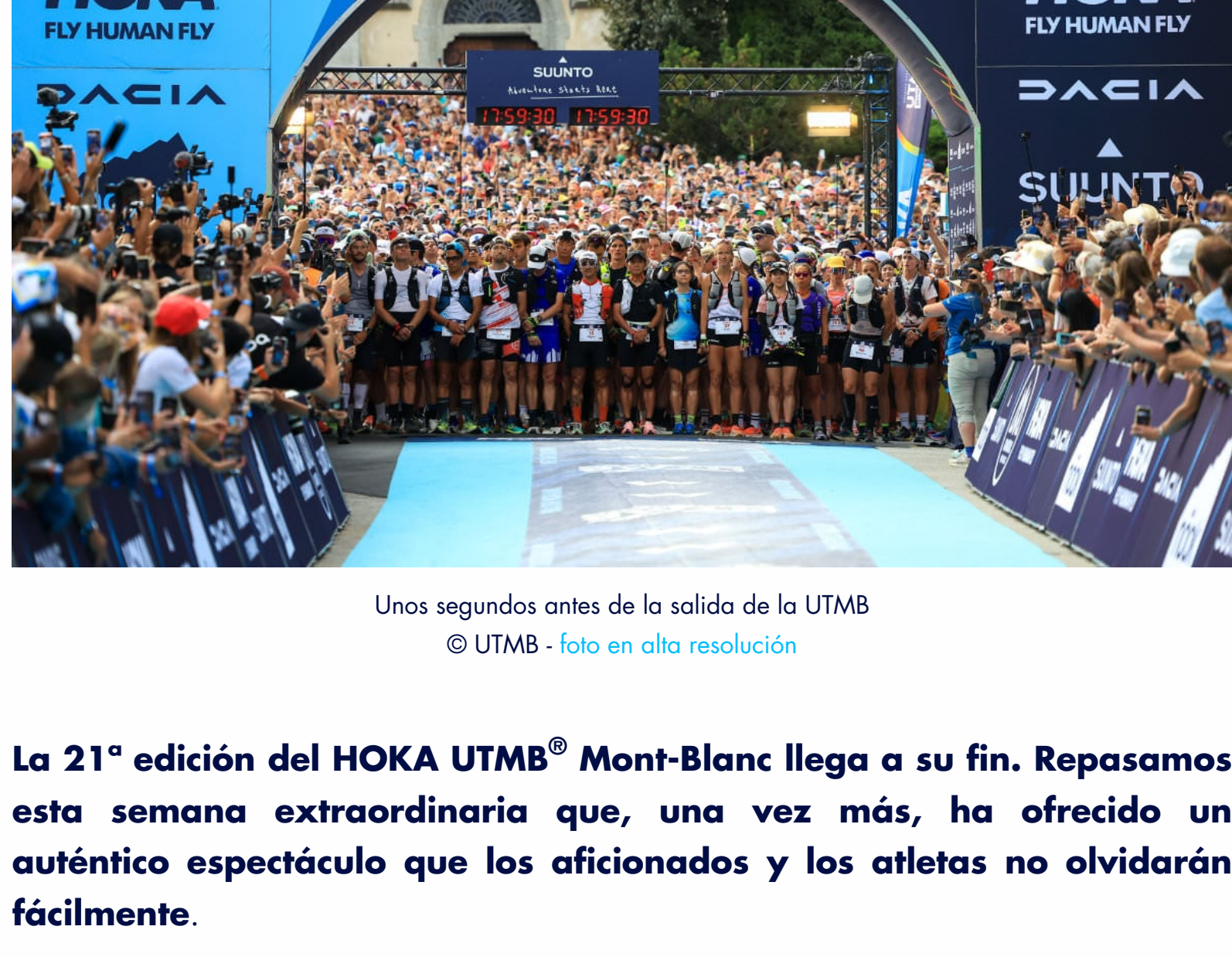
Unos segundos antes de la salida de la UTMB - foto en alta resolución