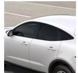
SEITENSCHIEBEN- EIN- FASSUNG