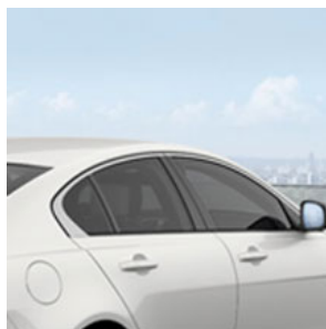
Sonnen- schutzver- glasung