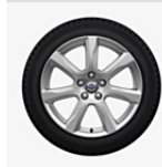
Leichtmetallräder PALLENE 7,0 x 17"